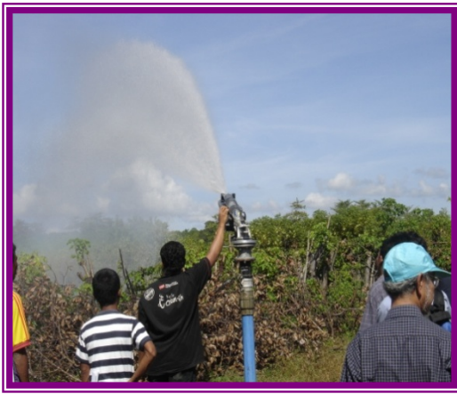
Gambar-3 Suasana pelatihan teknis