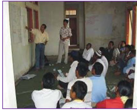
Gambar-4 Suasana pelatihan Non teknis

Setelah semua hal di atas, dilakukanlah pemanfaatan jaringan irigasi springkler melalui penanaman secara massal di lahan kering seluas 25 Ha yang dilaksanakan oleh pokja sringkler Batu Keruk, Arungan Bali dan Lembah Pedek. Pelaksanaan penanaman didukung oleh Dinas Pertanian Kabupaten Lombok Barat yang menyediakan bibit jagung sebanyak 300 kg. pihak swasta juga menarik pihak swasta untuk memberikan bantuan modal usaha tani untuk 18 (delapan belas) orang petani. Berikut adalah hasil tanam massal yang dilaksanakan oleh ketiga pokja Springkler