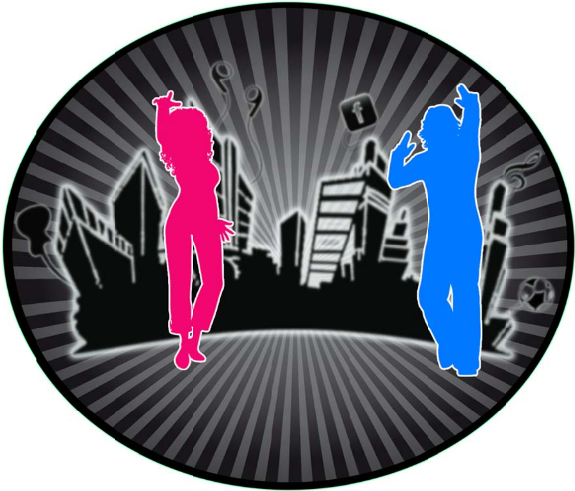
Con borde e iluminación exterior