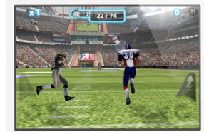
ちなみにゲームも出来ます。

iPhone4Sと同じタイミングで新しくなったiPod touch。今回は、その魅力に迫ります。