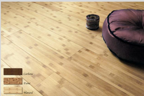
Sàn tre Ali

8. Không cần phân bón, thuốc trừ sâu hoặc thuốc diệt cỏ cần thiết: Không giống như hầu hết các cây công nghiệp, tre không cần phân bón để phát triển mạnh. Cũng không giống như các cây trồng khác, tre không cần chăm sóc kỹ và việc chăm sóc không tạo ra lượng hóa chất dư thừa cho môi trường.