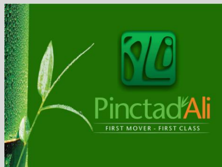
Pinctadali là công ty tiên phong cung cấp ván sàn tre tại Việt Nam

Có bị mối mọt? trong điều kiện thời tiết nóng ẩm ván sàn tre có cong vênh, co ngót không? chịu được mài mòn như thế nào? tuổi thọ của sản phẩm ra sao... là những lo ngại thường gặp của nhiều chủ nhà khi nói về ván sàn tre.