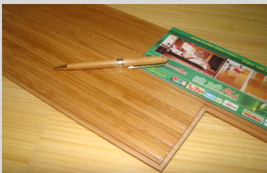
Sàn tre ép nghiêng

Ngoài 2 kiểu ghép truyền thống này, với công nghệ ghép hiện đại ngày nay tre còn có thể ghép và ép thành khối lớn như những khối gỗ. Tre ép khối tuy có giá thành cao hơn chút nhưng cứng và bền hơn ghép đứng và ghép nằm. Tre ép khối sử dụng những thanh tre nhỏ, mỏng để ép nên tiết kiệm nhiều nguyên liệu tre. Ghép khối làm cho những nốt tre không còn hiện rõ, cho ra những hoa văn khá lạ và giống gỗ. Kiểu ghép này thường phù hợp với những không gian hiện đại và có mật độ đi lại cao.