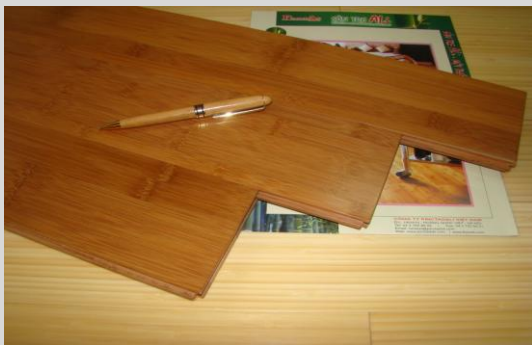
Sàn tre ép ngang

Các nan tre sau khi xử lý được đặt theo phương đứng một lớp và ghép thành ván. Cách ghép này gọi là ghép nghiêng hay ghép đứng. Ván sàn tre ghép đứng chỉ để lại những nốt tre nhỏ khoảng 3-5mm trên bề mặt. Những người không thích có quá nhiều nốt tre trên mặt sàn gây rối mắt hoặc sợ nhàm chán sau thời gian dài sử dụng có thể chọn ván sàn tre ghép nghiêng này. Vì ghép nghiêng những thanh tre vào nhau nên ván có độ chịu lực khá cao thích hợp cho những không gian nhiều hoạt động và ở những nơi có diện tích vừa phải cần sự nhã nhặn, sang trọng.