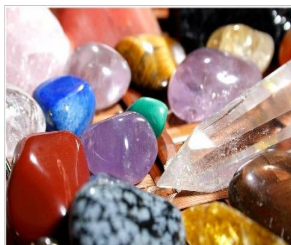
Akcesoria do masażu