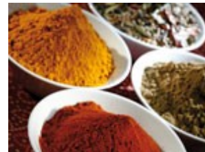
Proszki i algi