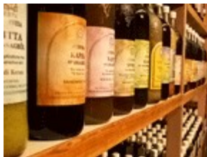
Oleje do masażu