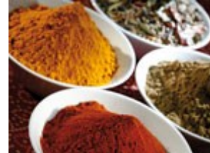
Proszki i algi