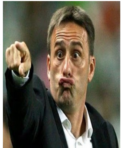
Imagem Absurda do Mês (olhem pro lado)

Os sócios do Sporting tinham sempre novos para me chamar...mas melro nunca foi um deles graças a Deus. Ficavam-se pelo “Filho da P***”, “Cabrão”, “Mijocas”, “Incompetente” ou “Desmaioritário”.