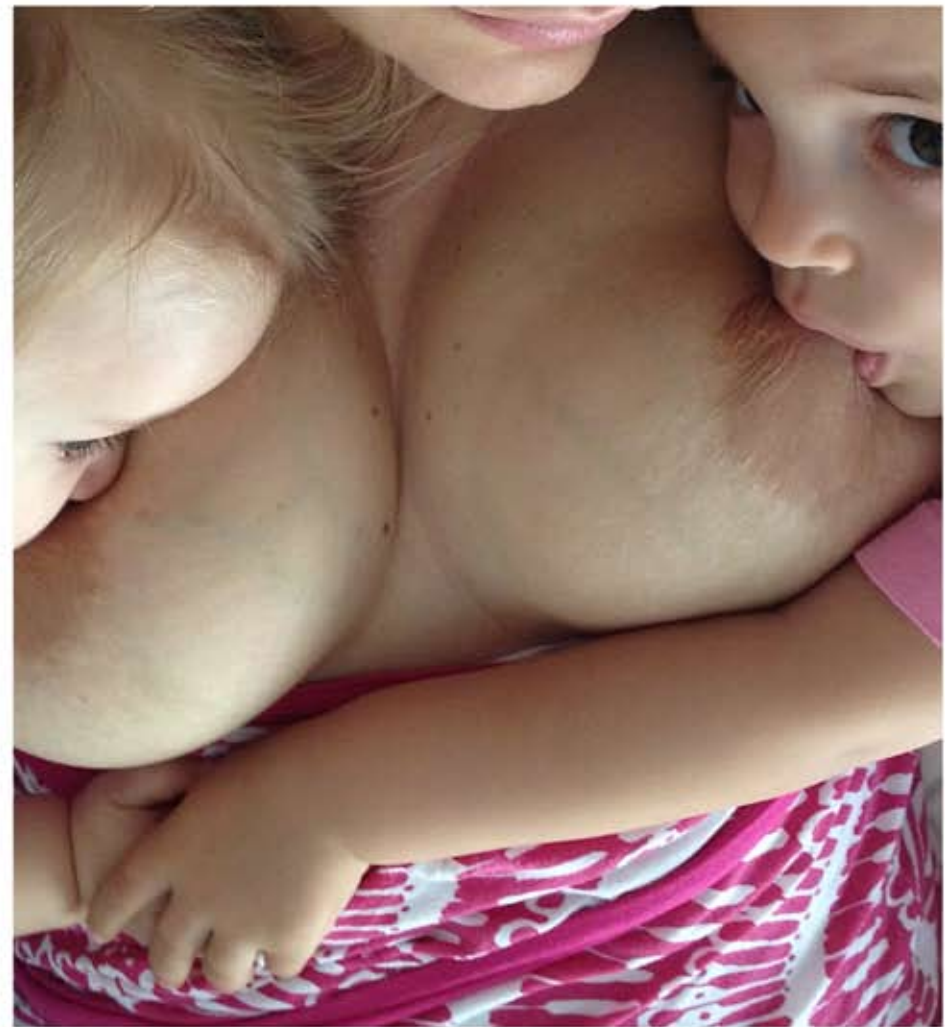
Οι μικρές μου έχουν 20 μήνες διαφορά... Συνεχίζουμε και φέτος με tandem nursing!!