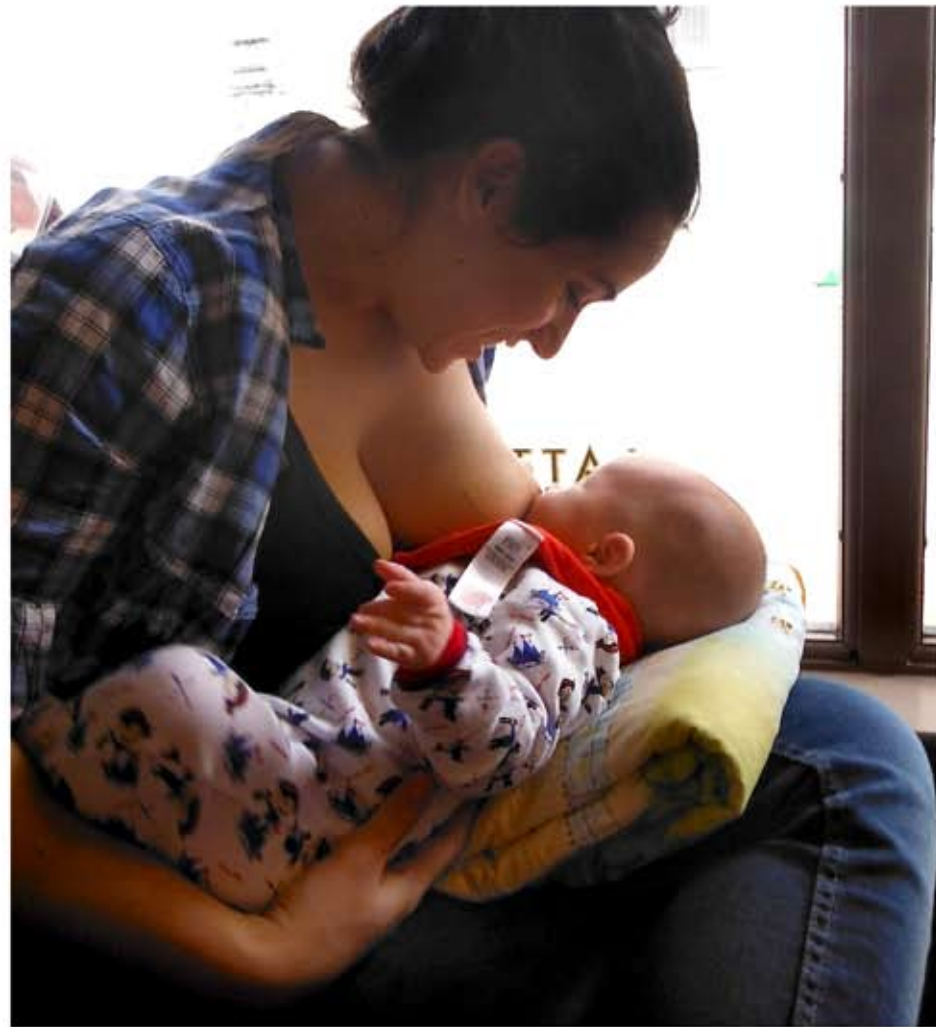
Ο θηλασμός είναι ένας μοναδικός, ανεκτίμητος θησαυρός και προσφέρεται δωρεάν!