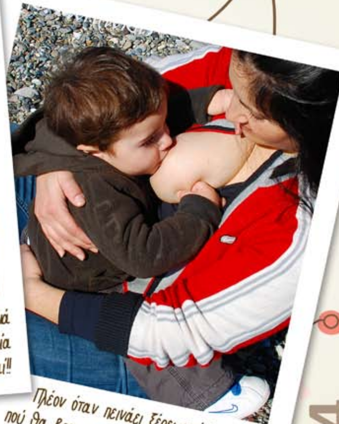
Πλέον όταν πεινάει ζέρει από μόνος του πού θα βρει το φαί του και... το διεκδικεί!!