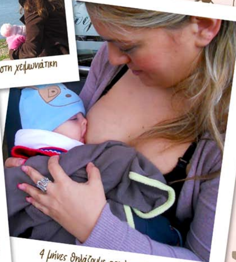
4 μήνες θηλάζουμε αποκλειστικά και συνεχίζουμε!