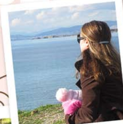
Θηλασμός στη χειμωνιάτικη λιακάδα!

Αν δεν βγάζεις γάλα δοκιμάζεις πάλι αργότερα. Να ξέρεις πως το στήθος δεν ανταποκρίνεται πάντα στην αντλία σε αντίθεση με το μωρό! Με την άντληση βλέπεις μόνο πόσο γάλα μπορεί να αντλήσει το θηλάστρο, όχι πόσο γάλα έχεις!