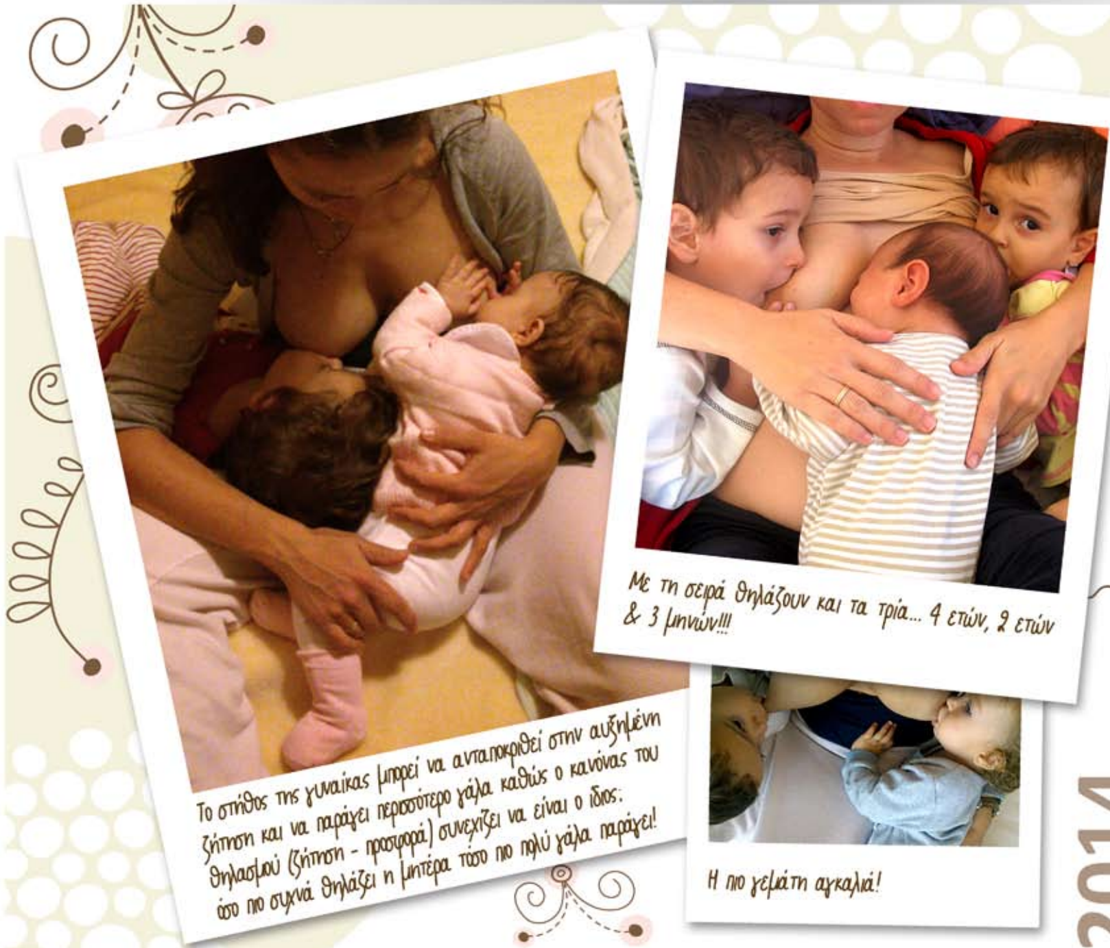
Με τη σειρά θηλάζουν και τα τρία... 4 ετών, 2 ετών & 3 μηνών!!!

Το tandem nursing (όπως είναι ο αγγλικός όρος, συμβαίνει όταν μια μητέρα έχει πχ ήδη ένα παιδί το οποίο συνεχίζει να το θηλάζει υατά τη διάρκεια μιας νέας εγκυμοσύνης και έπειτα, με τη γέννηση του μωρού, θηλάζει πλέον και τα δύο παιδιά της!