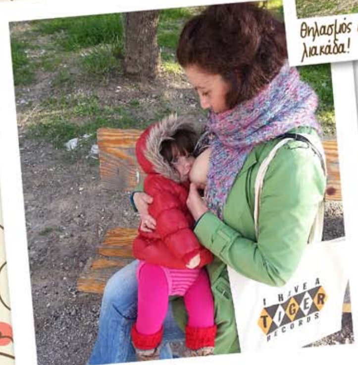
Με τη Χριστινούλα μου!!