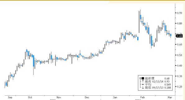
協同通信 參考數據