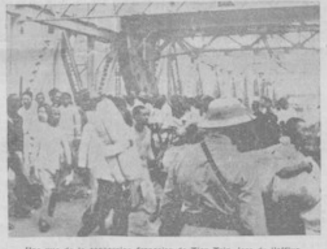
Une vue de la concession française de Tien-Tsin, lors de l'afflux des réfugiés, en juillet 1937

Les Etats-Unis collaborent étroitement avec l'Angleterre et la France pour un règlement rapide du différend