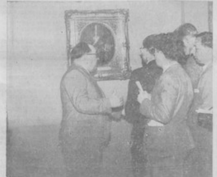
Voici la cimaise sur laquelle le petit tableau de Watteau était accroché (à gauche). Le tableau correspondant, « La Pinette », est en partie caché par les journalistes...