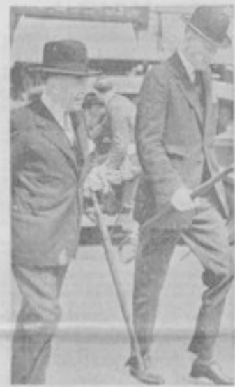
M. Strang, ambassadeur de France, accompagné de lord Halifax

Moscou, 14 juin. — M. Strang est arrivé à Moscou, à 11 h. 30, par le train de Varsovie.