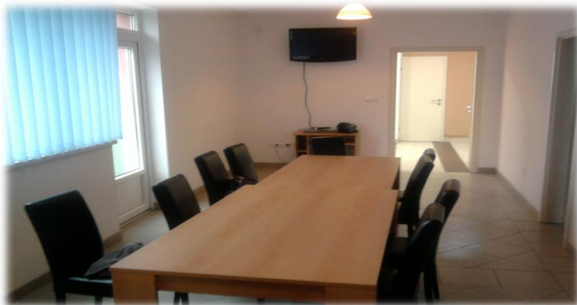
Slika 9. Zbornica

Zbornica ima funkciju i kafeterije budući da je spojena ulazom u kuhinju, namjenjena je za pauze i odmor u toku ili poslije održavanja instruktivne, kursne nastave i polaganja ispita.