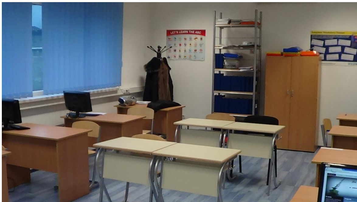
Slika 4. Kabinet za izvođenje kursne nastave iz Engleskog jezika i općih obrazovnih predmeta