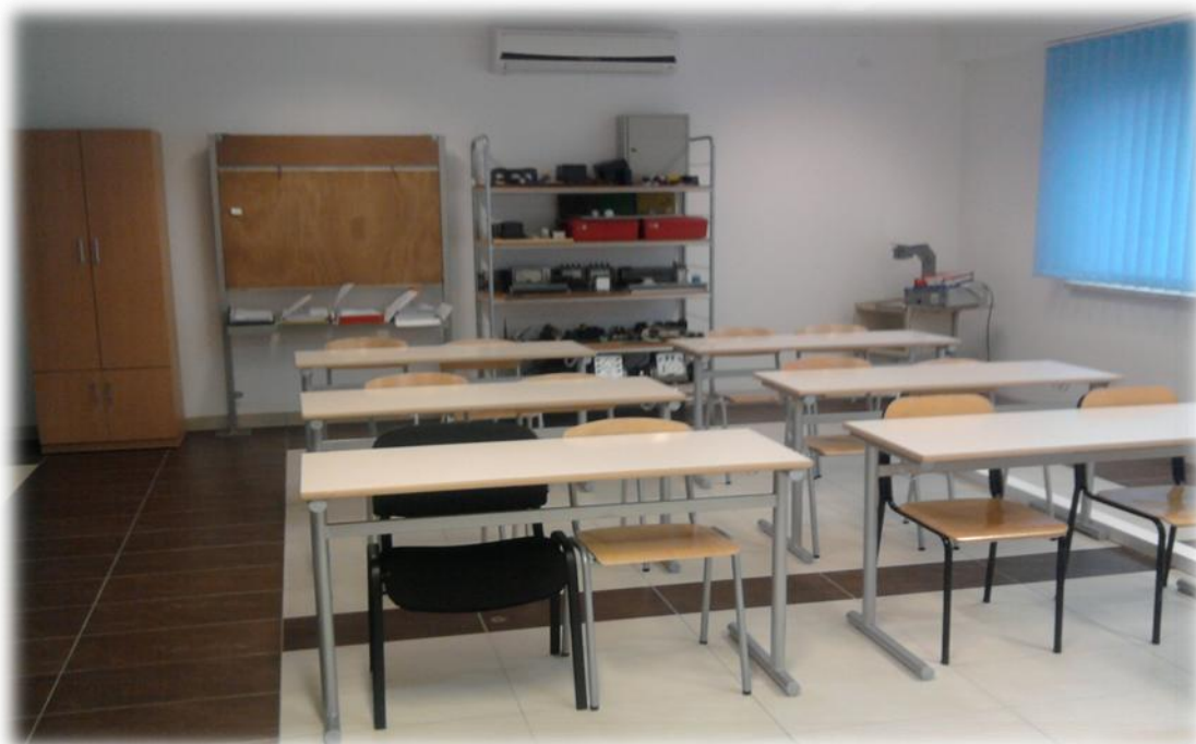
Slika 19. Učionica za izvođenje stručno-teoretske nastave za saobraćajnu i mašinsku školu