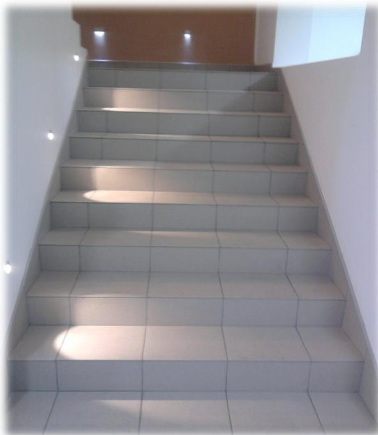
Slika 11. Stepenice prema spratu

Prema prvom spratu Centra vode stepenice koje imaju posebne reflektore za sigurnost prolaznika.