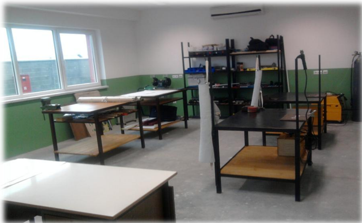
Slika 8. Radionica za mašinsku struku

Zbornica ima funkciju i kafeterije budući da je spojena ulazom u kuhinju, namjenjena je za pauze i odmor u toku ili poslije održavanja instruktivne, kursne nastave i polaganja ispita.