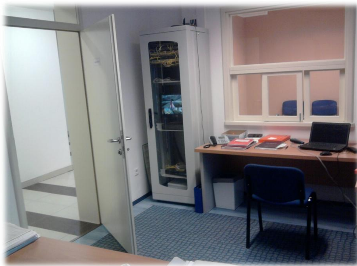
Slika 3. Prijavnica sa unutrašnje strane

U prijavnici površine 25 m 2 je smješten ekran za praćenje nadzornih kamera koje pokrivaju prostor Centra, dvorišta, i ulaza u dvorište Centra (Slika 2.). Zaposlenici u prijavnici imaju neophodnu opremu za rad i povezivanje sa svim kancelarijama u Centru, računarsku opremu, telefonske linije, fax.