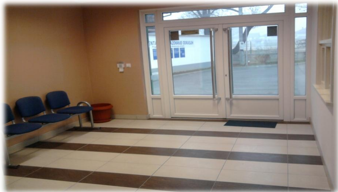
Slika 2. Prijavnica sa vanjske strane