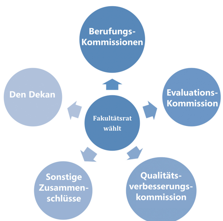
Der Fakultätsrat wählt verschiedene Gremien

Insbesondere können sich die Vertreter der Studierenden einbringen. Ihre Aufgabe ist es, die Themen im Sinne der Studierendenschaft zu beleuchten und die Entscheidungen so auszugestalten, dass die Studierenden davon profitieren. Außerdem können sie eigene Projekte einbringen, dies mit den Anwesenden besprechen und sich diesbezüglich Rat und Unterstützung seitens des Professoriums ermöglichen.