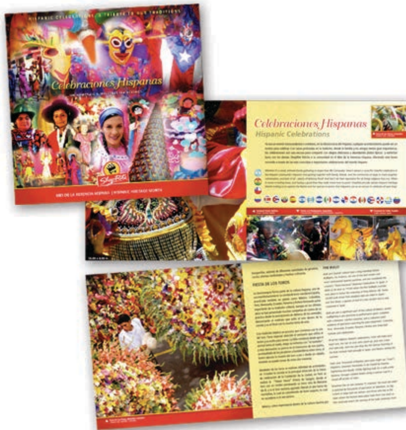
2009 Hispanic Heritage Booklet Print/Collateral Client: ShopRite

Brand Strategist | Creative Director | Marketing Director