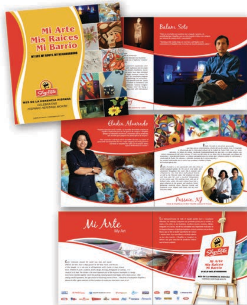
2010 Hispanic Heritage Booklet Print/Collateral Client: ShopRite