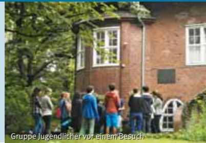
Gruppe Jugendlicher vor einem Besuch