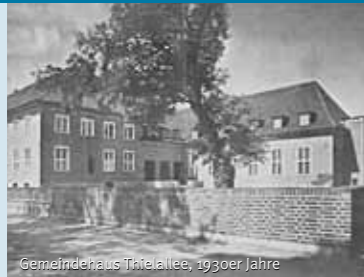
Gemeindehaus Thielallee, 1930er Jahre