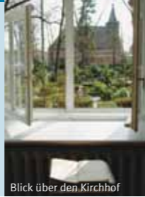
Blick über den Kirchhof