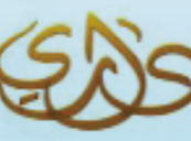
شركة وادي جدة