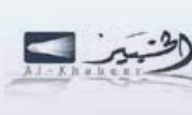
شركة الخبير المالية