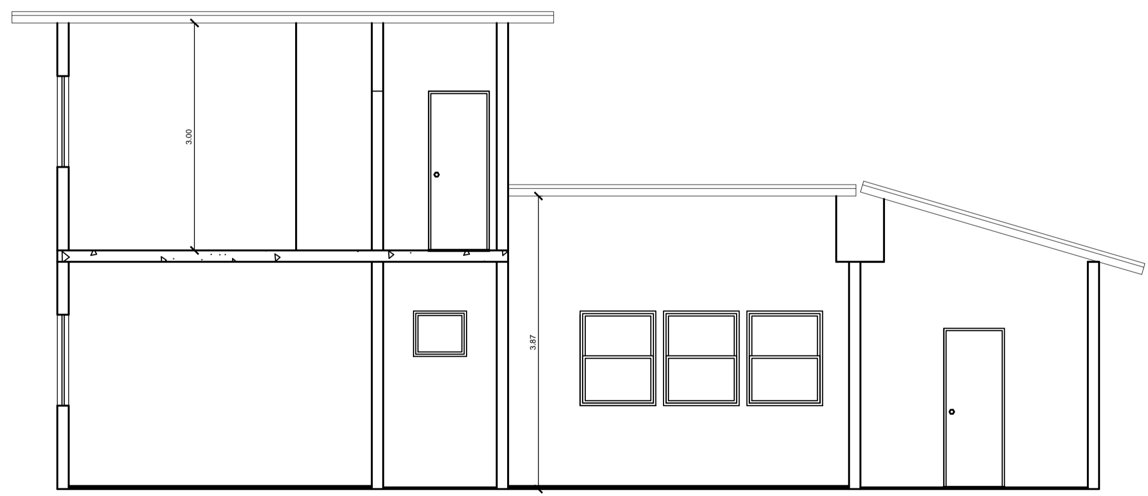
CORTE L1 ESCALA 1:50