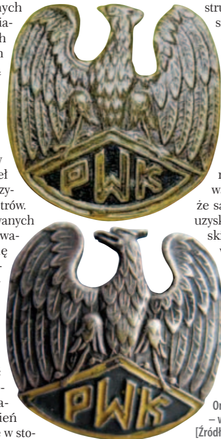
Orzeł mundurowy PWK – wersja mała

Drugim systemem stopni były wprowadzone niejako odgórnie, wspomniane już oznaczenia przeszkolenia fachowego i stopni instruktorskich PWK. Stopnie te były nadawane i weryfikowane urzędowo, jednakże samo szkolenie, w celu uzyskania stopni instruktorskich, przeprowadzano w stowarzyszeniach. Wyjątek stanowił Wyższy Kurs Instruktorski PWK, który był przeprowadzany centralnie przy PUWFiPW. Przeszkolenie fachowe mogły przechodzić pewiaczki do stopnia