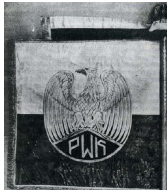
Plat sztandaru OPKdOK/OPWK

wiązującego Pewiaczki . Uczestniczki i kadra obozu szkoleniowego PWK. Pośrodku w bluzie nowego typu z Krzyżem Walecznych insp. Stefania Frołowiczowa. Część instruktorek ma na głowach furazerki. Zdjęcie znakomicie obrazuje różnorodność materiałów, z których są wykonane spodnie i kurtki, a co za tym idzie stopień ich wypłowienia oraz różnorodność obuwia. Spała 1936 rok