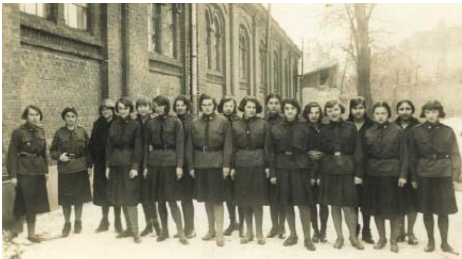
Zbiórka Hufca Szkolnego, uczestniczki posiadają suknie typu HS, bluzy starego typu bez granatowych naramienników i mankietów. Zwraca uwagę różnorodność pasów. Prawdopodobnie zdjęcie wykonane w połowie lat trzydziestych [Fot. ze zb. FGEZ]

we guziki. Prawdopodobnie był wykonany z tkaniny czesankowej (krepa, kamgarn, diagonal), a w pojedynczych przypadkach widuje się frencze wykonane z tkaniny lnianej. Frencz miał kołnierz wykładany szerokości pięciu centymetrów. Na kołnierzu do 1933 roku umieszczono patki granatowe, w kształcie rombu z oznakami służby i stopni organizacyjnych 29 . Od 1933 roku na kołnierzu umieszczano tylko oznaczenia stopni organizacyjnych 30 . Oprócz tego na patkach przymocowywano orły odmiany małej. Kieszenie górne, o wymiarach piętnaście na dwanaście centymetrów, posiadały kontrafałdę szerokości czterech centymetrów oraz były zamykane małym skórzanym guzikiem klapką o długości sześciu centymetrów. Dolne większe kieszenie miały wymiary dwadzieścia cztery centymetry długości i dwudziestu centymetrów szerokości.