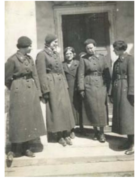
Instruktorzy i członkinie OPKdOK w płaszczach sukiennych, po mszy w poznańskiej farze z okazji poświęcenia sztandaru dla Koła Poznań. Trzecia Pewiaczka z lewej ma na sobie nieregularny dwurzędowy płaszcz. Poznań, 8 XI 1936 rok