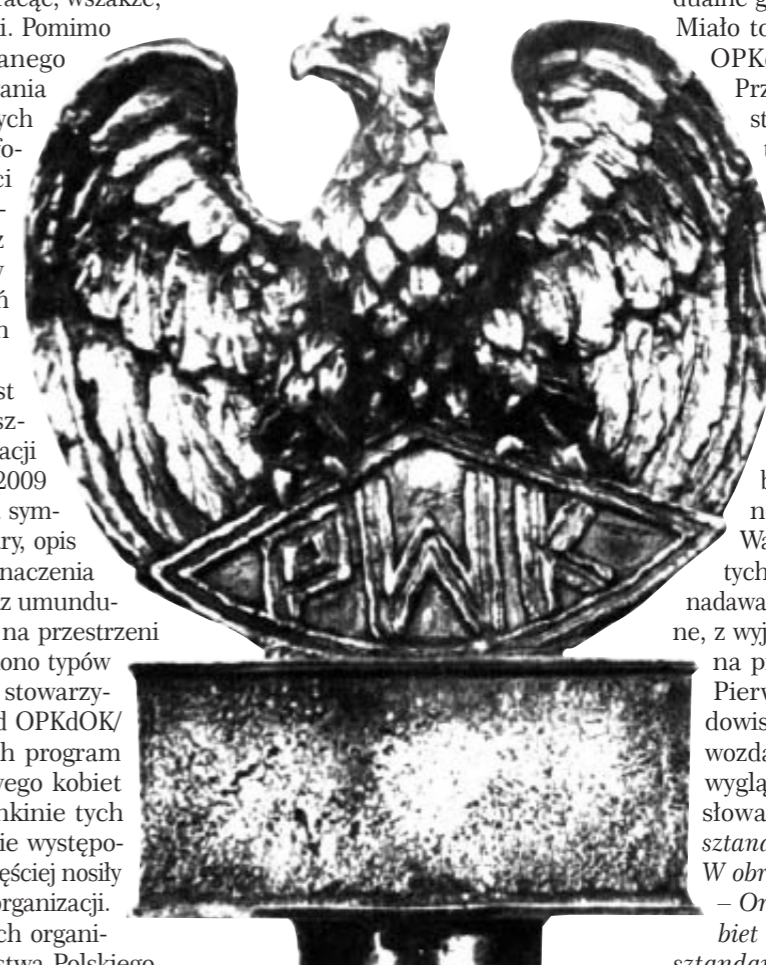
Kopia Orła sztandarowego OPKdOK/OPWK

OPKdOK/OPWK będąc przez cały okres swojego istnienia organizacją społeczną nie mogło używać symboli zastrzeżonych dla Wojska Polskiego oraz