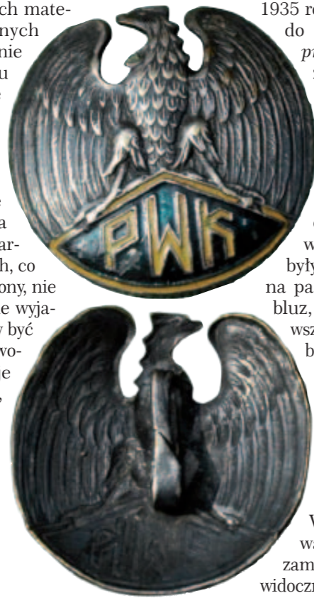
Orzeł mundurowy PWK – wersja duża

PWK 2 . Z zachowanych materiałów ikonograficznych można dosyć dokładnie opisać wygląd płatu sztandaru. Chorągwie PWK były kwadratem o przepuszczalnych wymiarach metr na metr. Płat był wykonany prawdopodobnie z adamaszku. Lewa strona płata była w barwach biało-czerwonych, co do kolorów prawej strony, nie udało się dostatecznie wyjaśnić tej kwestii. Mogły być to kolory biały i czerwony lub, co też wydaje się prawdopodobne, granatowy i żółty. Kolory te były tradycyjnymi barwami PWK. Sztandar z trzech