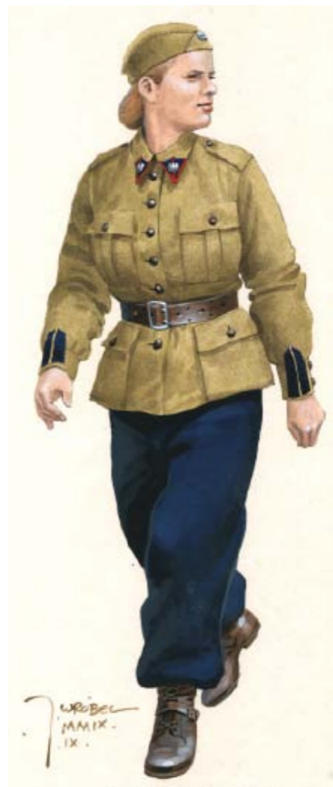
Podinstruktorka w stopniu młodszej aspirantki. Umundurowanie polowe, Spała, sierpień 1939 roku [Ryc. A. Wróbel, ze zb. autora]

Ostatnim dodatkiem występującym w umundurowaniu OPKdOK/PWK i obowiązującym w czasie wystąpień uroczystych, był granatowy krawat. Wykonany był on z sukna bądź płótna, takiej długości, aby końcówka chowała się pod pasem głównym. Noszony był w czasie uroczystych wystąpień do bluz, a obowiązkowo przez cały czas do frenczów. Od drugiej połowy