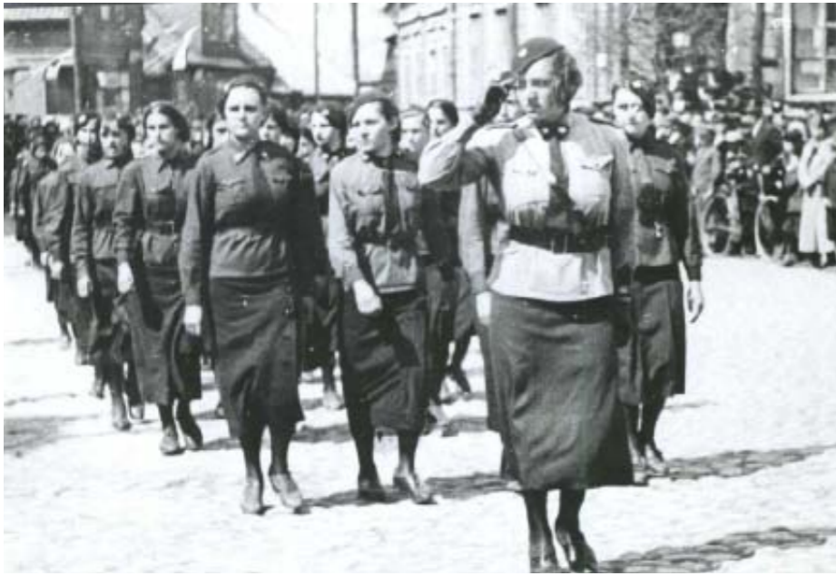
Defilada z okazji święta 3 maja, Pewiaczki w spódnicach obowiązujących od 1935 roku. Kierunkowa kolumny posiada nieregularne zapięcie sukni w postaci braku listwy kryjącej. Bluzy starego typu bez granatowych naramienników i mankietów, 1936 rok

tymentrów z klapką o wymiarach sześć na cztery centymetry. Same kieszenie posiadały fałdy zaprasowane do wewnątrz 28 . Po przeanalizowaniu dostępnych fotografii wynika, że zaprasowanie fałdy stosowano głównie w dolnych kieszeniach, pozostawiając górne w prostej formie lub umieszczając pośrodku kontrafałdę podobnie jak w bluzach PWK. Jest to nie jedyne odstępstwo jakie można zauważyć na zdjęciach związanych z tą kurtką, najczęściej jest to mniejsza ilość guzików lub nietypowa długość samej kurtki. Kurtka ta, podobnie jak bluza, przysługiwała wszystkim pe-wiaczkom bez względu na stopień.