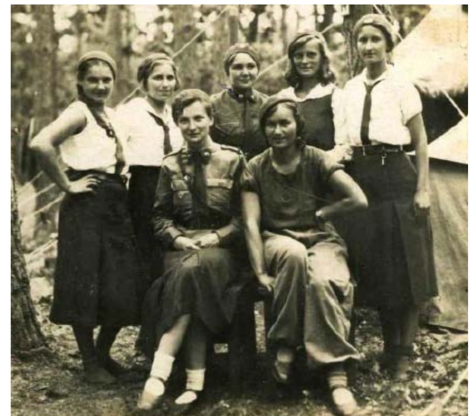
Obóz PWK. Dobrze widoczne spódnice tzw. Starego wzoru oraz charakterystyczne karabińczyki przy pasach głównych. Część kursantek ma na sobie białe bluzki sportowe w wersji wyjściowej z granatowym krawatem. Spała, prawdopodobnie pierwsza połowa lat trzydziestych