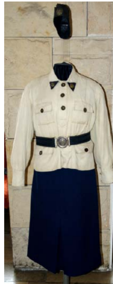
Mundur członkini OPKdOK/OPWK ze zbiorów MWL w Bydgoszczy [Fot. autor]

nie występują znaczące uchybienia świadczące o nie przestrzeganiu wytycznych dotyczących oznaczeń wyszkolenia i stopni organizacyjnych.