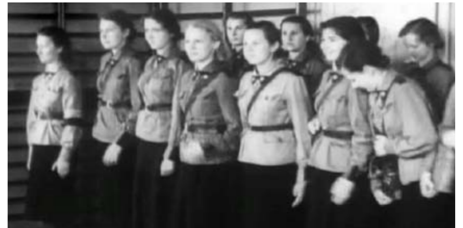
Ćwiczenia pokazowe p.gaz, część uczestniczek posiada kurtki typu przejściowego. Kurtki posiadają granatowe naramienniki oraz zielone mankiety z naszytymi patkami obowiązującymi po 1933 roku. Kadr z kroniki PAT [Fot. ze zb. Autora]

Kiedy w 1935 roku wchodzi do użytku Tymczasowe przepisy mundurowe 26 , a chwilę później Instrukcja mundurowa 27 , pojawia się na wyposażeniu wspomniana już kurtka mundurowa. Krojem była ona bardzo podobna do kurtek wz. 36. Kolor bluzy, przepisy mundurowe określają, jako piaskowy – beige (sic!), miała być ona wykonana z drelichu wyrobu gabardynowego. Dla instruktorek mogła być to wełna lub w wersji letniej roboczej samodziałowe płótno koloru szarego. W talii kurtka miała być lekko wcięta, a jej długość miała być tak dobrana, aby dół poły nie dosięgał płaszczyzny siedzenia o cztery centymetry. Kurtka była zapinana z przodu na siedem guzików czterodziurkowych o kolorze materiału. Guziki rozstawione powinny być w ten sposób, aby pas główny przechodził między szóstym a siódmym guzikiem. Kołnierz stojący – wykładany był wykonany z podwójnego materiału, szerokości sześciu centymetrów od przodu zwężający się ku tyłowi. Na rogach kołnierza, podobnie jak w bluzach, naszywano patki w kształcie trójkątów o długości ramienia sześciu centymetrów. Patki powinny być wykonane z materiału niefarbującego. W przypadku patek stosowanych przy kurtkach wełnianych przeznaczonych dla instruktorek, powinny być