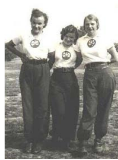
Trzy kursantki obozu szkoleniowego PWK, przygotowujące do zajęć sportowych. Ubrane są w granatowe spodnie sportowe oraz koszulki gimnastyczne z przypiętymi wyhaftowanymi odznakami PWK. Prawdopodobnie Spała po 1935 roku