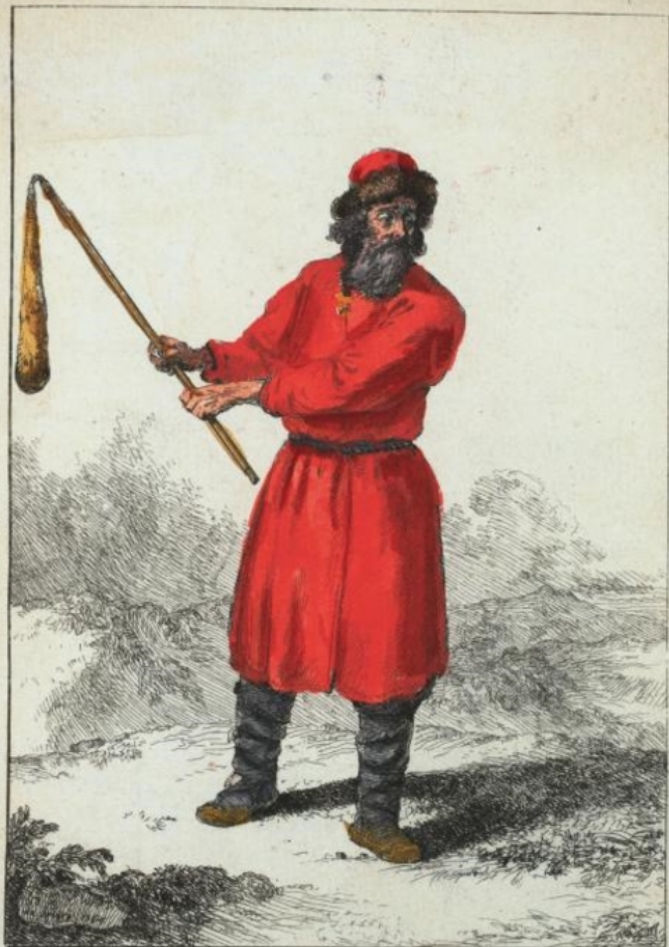
Boureau du Corps des Strelits on assomoit avec un fleau les gens Condamnés a mort.