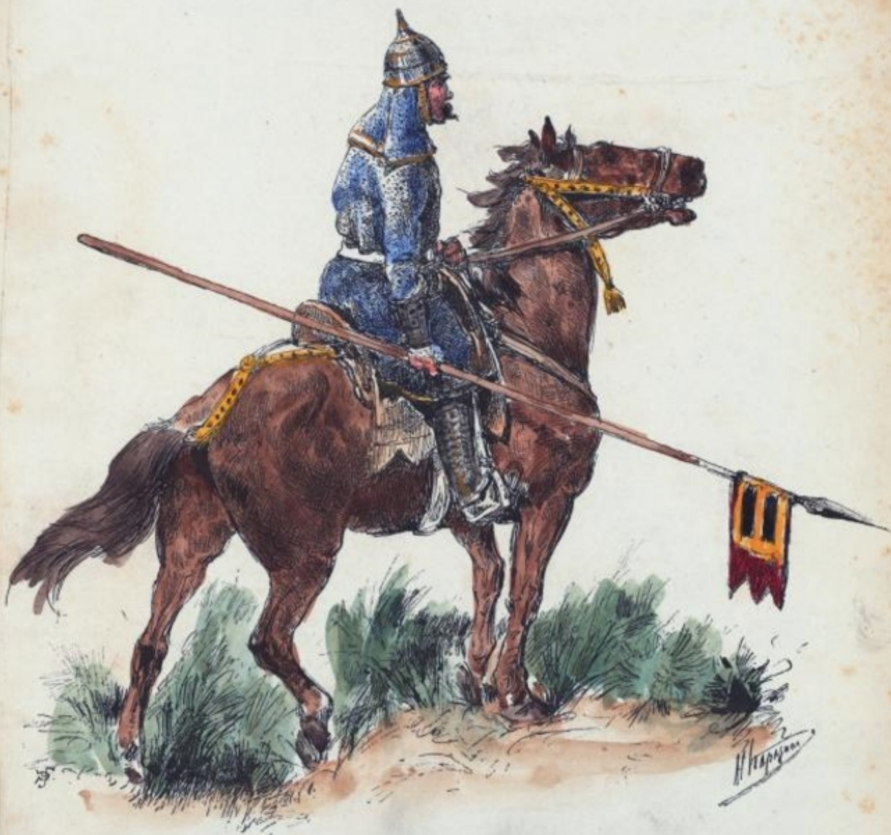
ВСАДНИКЪ КОНЦА X СТОЛѢТІЯ.