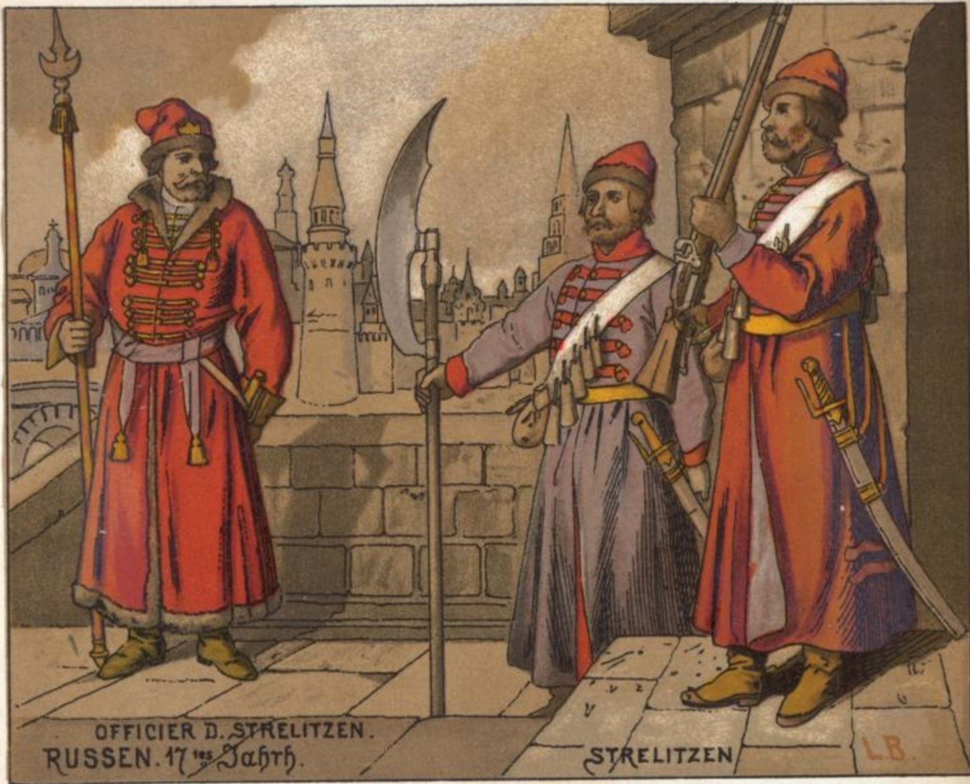
OFFICIER D. STRELITZEN. RUSSEN. 17 tes Jahrh.