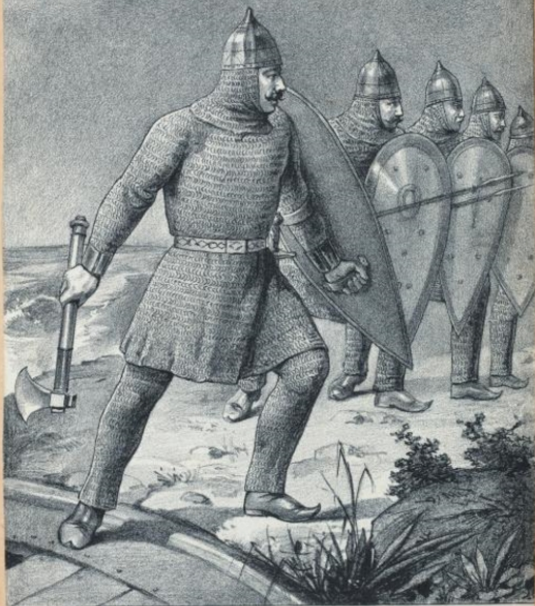
Русское вооружение в X и XI столетиях