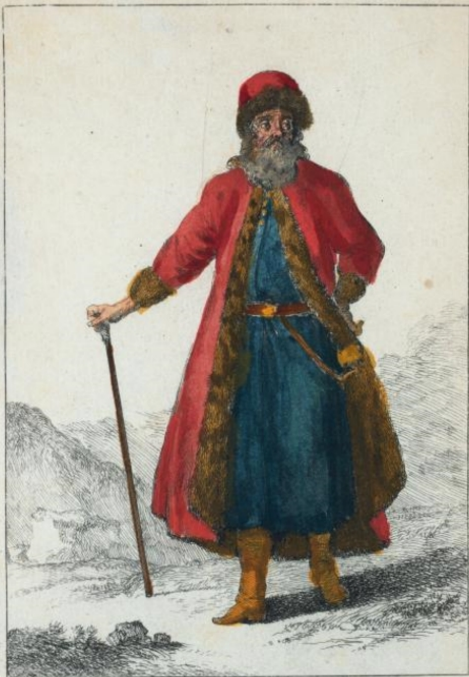
Lieutenant Colonel du Corps des Strelits.