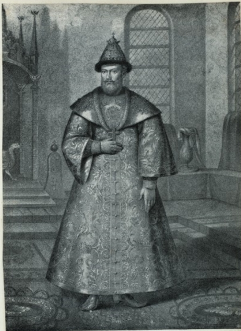
Изображеніе Царя Михаила Теодоровича въ опашнѣ, съ ожерельемъ и въ шапкѣ,

принадлежавшихъ къ одеждѣ Россійскихъ Государей съ XIV до XVIII столѣтія