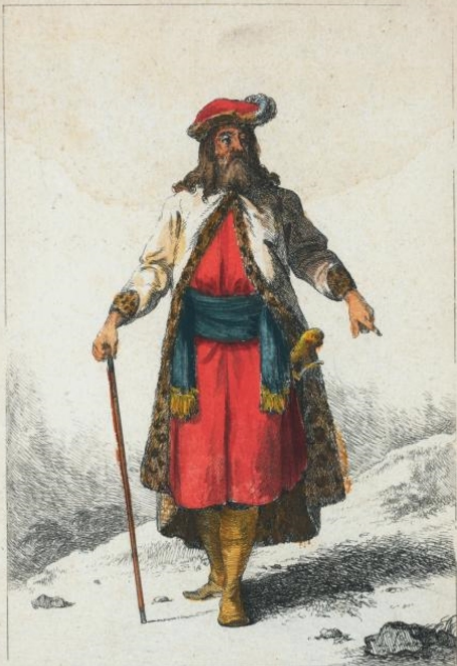
Colonel du Corps des Strelits .