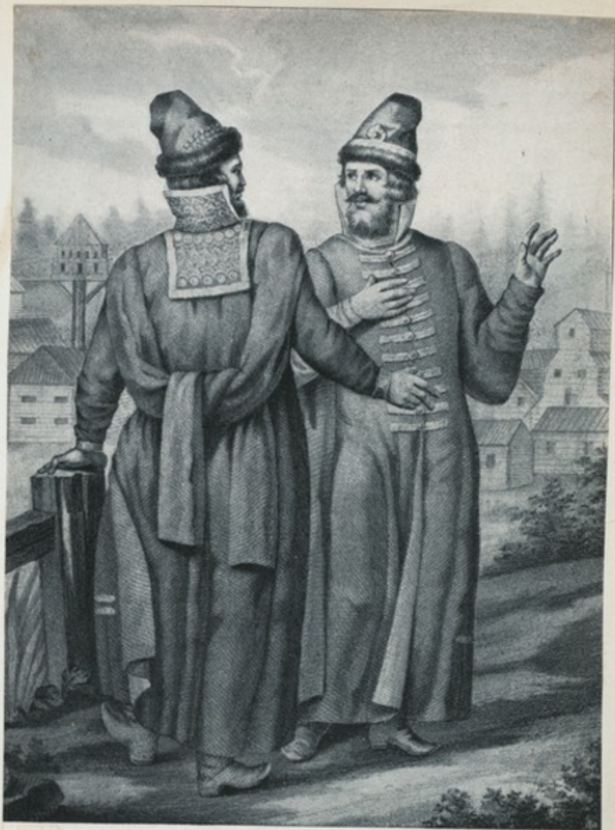
Русская одежда съ XIV до XVIII столѣтїя