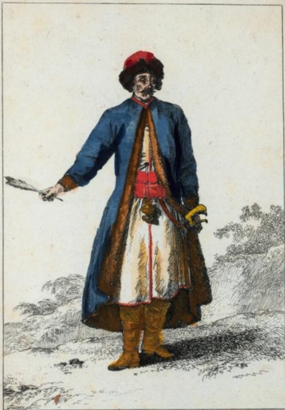
Ecrivain de la Chancellerie du Corps des Strelits.