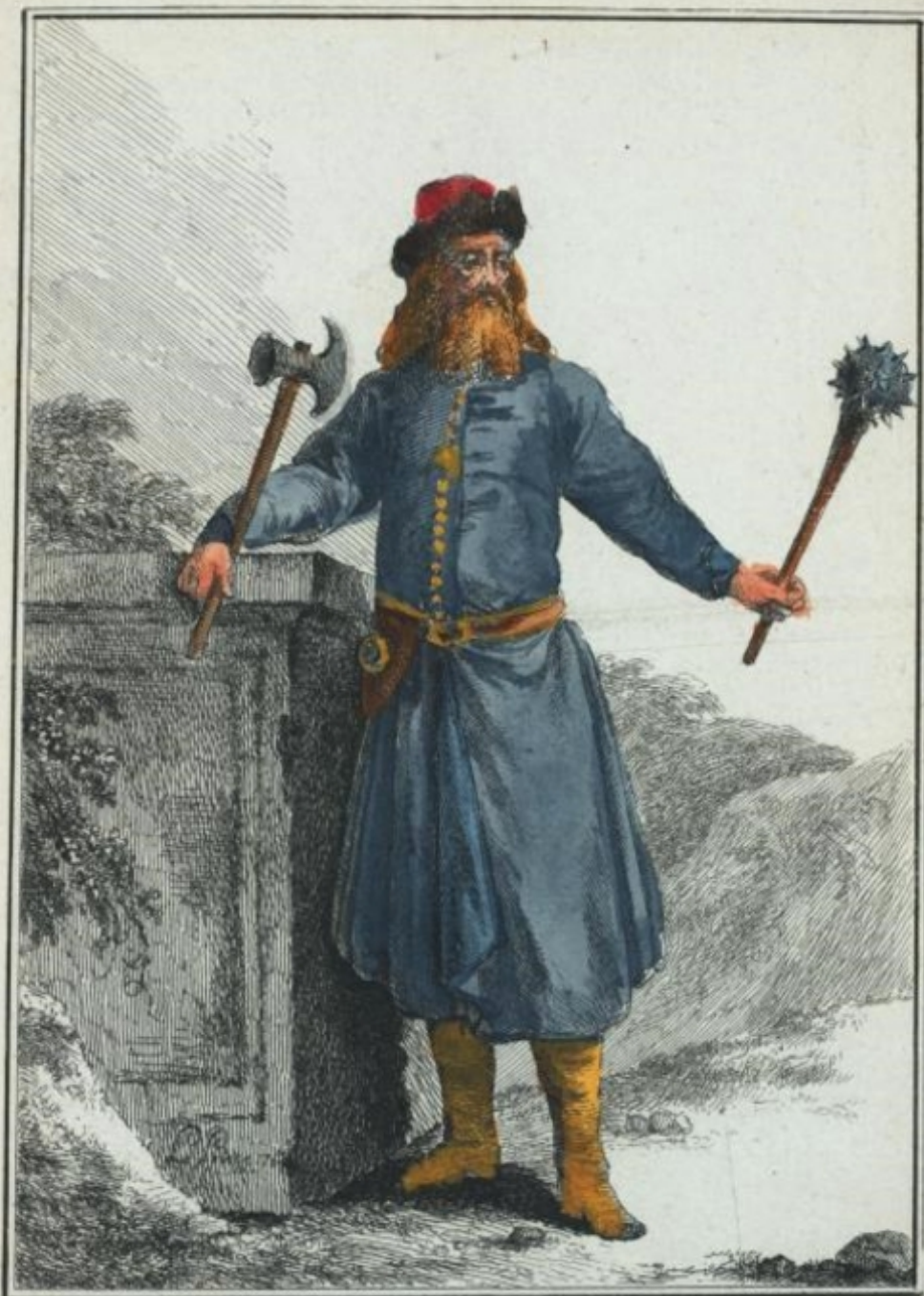
Commandant du Corps des Strelits.