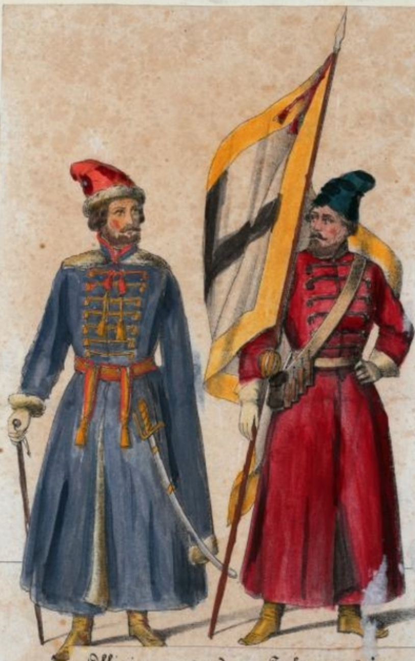
Offizier und Fahmenträger der Sirelitzzen.