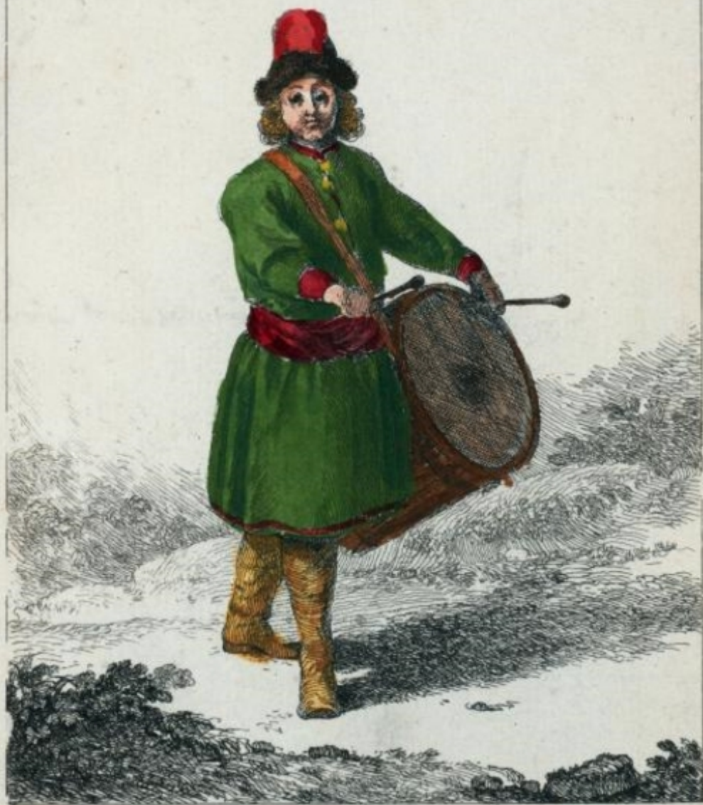
Tambour des Strelits.