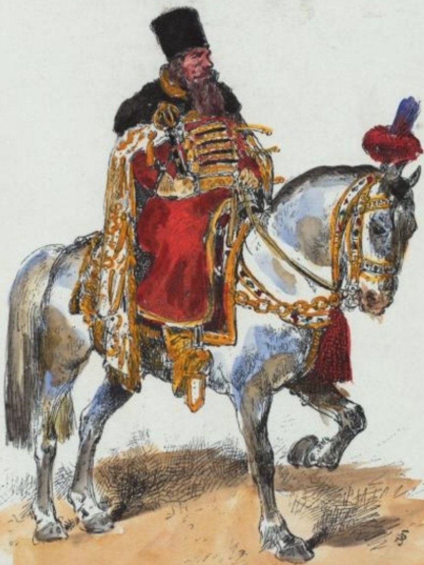
БОЯРИНЪ ВЪ XVII СТОЛѢТІИ ВОЕВОДА БОЛЬШОГО ПОЛКА.