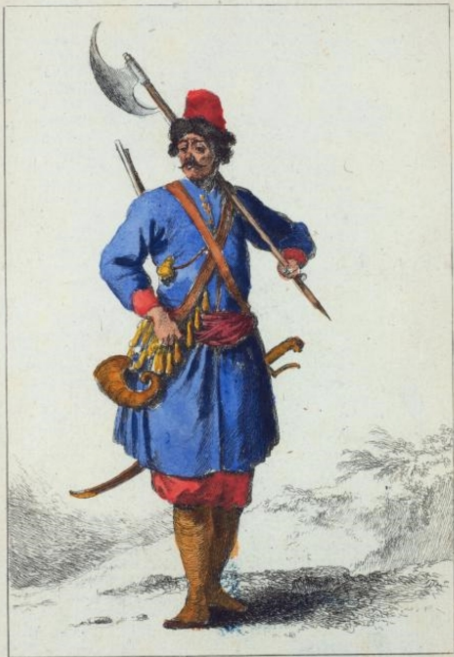
Soldat du Corps des Strelits. Sous les Armes.