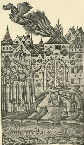
А., л. 88.—Сх. столб. 319, пришествіе 6.