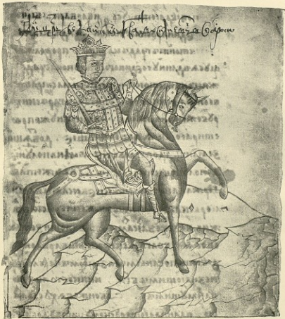
А., л. 2.—См. стр. 6, 191, приложение а.