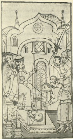
М., з. 31.—См. столб. 203, изображение 6.