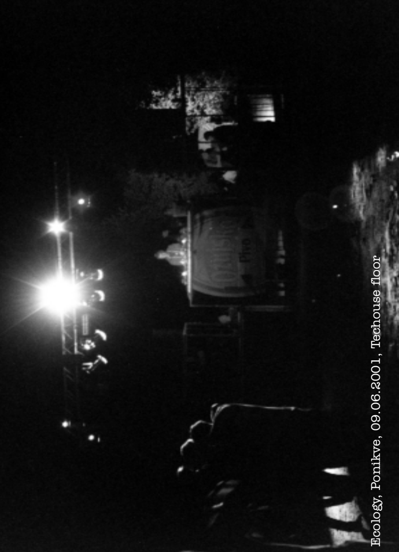
Ecology, Ponikve, 09.06.2001, Techouse floor