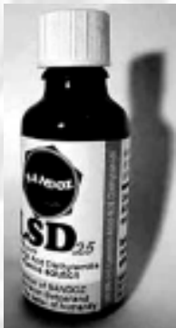
Komercijalno pakovanje tekućeg LSD-a.