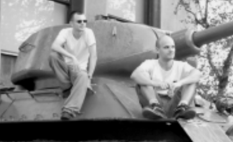
TT i Strangelove prilikom predaha nakon napornog partyja. Vrijeme i mjesto snimke nepoznati.

U doba kada se sav normalan svijet preselio na jug i open-airove, vodstvo PLURA zaputilo se prema sjeveru i zaupšljivim podzemnim klubovima. I uopće nam nije bilo loše.