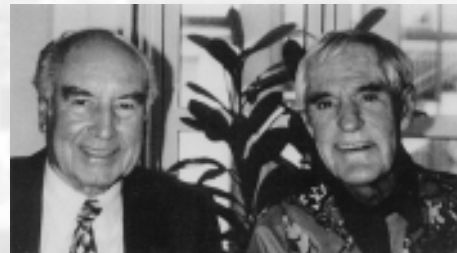
Stvoritelj i Apostol: Dr. Albert Hoffman i Dr. Timothy Leary snimljeni 1993. u Hamburgu.

Uz napomenu da se ne smije koristiti na oboljelima od nekih mentalnih bolesti, posebno je navedeno da se Delysid primjenjuje samo pod liječničkim nadzorom, koji se ne smije prekidati sve dok se efekti lijeka u potpunosti ne povuku. Kod primjene LSD-a, dugo zaboravljeni i traumatski događaji mogu se ponovo pojaviti u svijesti, čime se