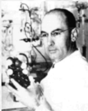
Dr. Albert Hoffman u svom laboratoriju...

Istraživanja alkaloida ergota išla su dalje i postignuti su mnogi proboji, ali svo to vrijeme, dr. Hoffman imao je osjećaj, često karakterističan za znanstvenike, da LSD-25 ima još svojstava do kojih se nije došlo u prvom istraživanju i koja zahtijevaju daljnje analize. 16. travnja 1943. Hoffman ponovo sintetizira LSD. U Hoffmanovom laboratorijskom dnevniku stoji: "Odnjedom sam postao čudno opijen. Vanjski svijet postao je promjenjen, kao u snu. Predmeti su izgledali kao da postaju živi; poprimali su neobične dimenzije; i boje su postale sjajnije. Čak su se percepcija sebe i osjećaj za vrijeme promijenili. Kada su oči bile zatvorene, šarene slike brzo su se