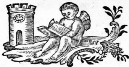
ТАБЛИЦА РОССИЙСКОЙ ИСТОРИИ.

Отъ основанія Государства сѣ . . . до 864 года.