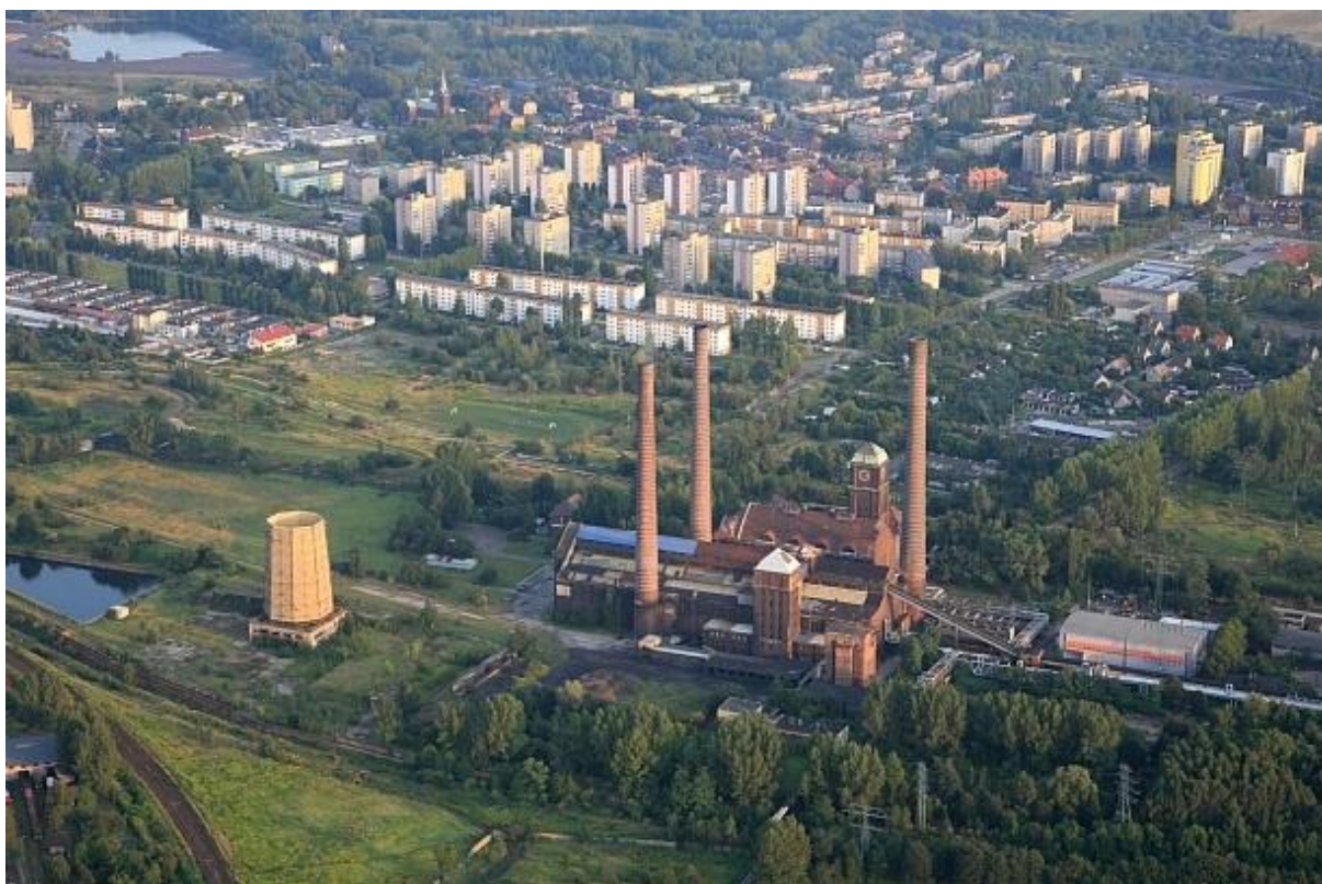
Szombierki z lotu ptaka

Mimo, że nowa lokalizacja znajduje się 500 metrów bliżej do oddziału sieci własnej, to położenie to pozwoli utrzymać ciągłość obsługi klienta. W przeciwnym razie klienci byłiby skazani na „wyprawę do centrum”, bądź zrezygnowaliby z obsługi GNB - w budynku starej placówki jest oddział ING i Banku Spółdzielczego, a w niedalekiej okolicy Credit Agricole, Alior Partner oraz BZ WBK. Jest to jedyna lokalizacja w okolicy, która spełnia kryterium banku względem wytycznych technicznych. Reszta lokali na osiedlu usytuowana jest w starych, niewyremontowanych, nieestetycznych, trudnodostępnych kamienicach.