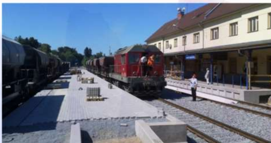
...po částečné rekonstrukci