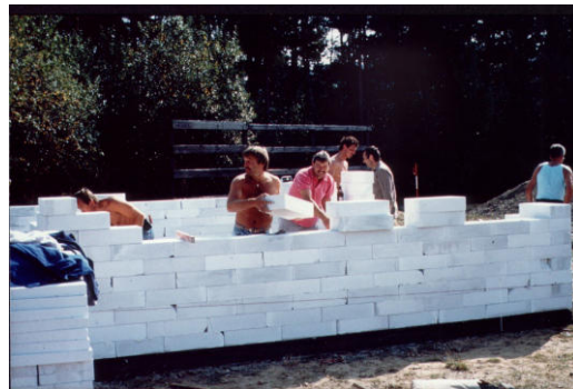
Das Tennisheim wird gebaut

Plätze 3 u. 4, sowie der Baubeginn für die Erweiterung des Tennisheimes, um Sanitär- und Umkleidebereich, in Angriff genommen.