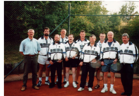
Jungsenioren Meistermannschaft 1999