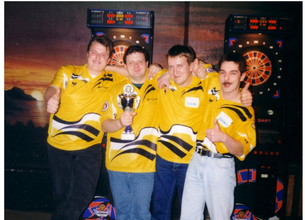
Die Siegermannschaft des Ligapokals 1995

Neben den vielen Einzelerfolgen bei Turnieren zählt der Gewinn des Liga-Pokals im Jahr 1995 zu unserem bisher größten Erfolg.