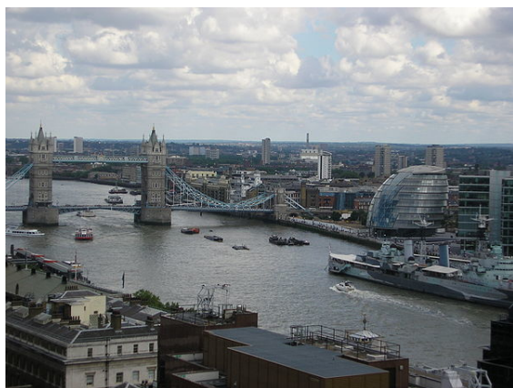
Transport wodny na Tamizie

W dzielnicy Woolwich (część Greenwich), około 10 km w dół rzeki od Tower, zlokalizowany jest duży port handlowy. Dzięki pływom morskim w estuarium Tamizy, port londyński jest przystosowany do obsługi jednostek o zanurzeniu 11,2 m. Większość ładunków jest przeładowywana ze statków na barki, które dostarczają towary do zakładów przemysłowych po obu brzegach Tamizy, docierając do 225 km w głąb wyspy. Przeładunki w porcie w 2000 roku wyniosły 62 mln ton, z czego najwięcej przypada na surowce dla przemysłu spożywczego, włókienniczego, papierniczego i paliwowego.