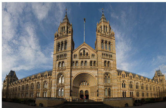
Muzeum Historii Naturalnej

Londyn jest wielkim ośrodkiem kulturalnym o światowym znaczeniu, swe siedziby mają tu m.in.: