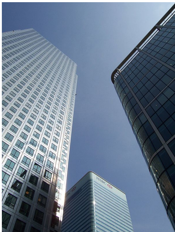
Canary Wharf, drapacze chmur

firm konsultingowych oraz ponad 100 filii banków zagranicznych, m.in. ze Stanów Zjednoczonych (Merrill Lynch), Szwajcarii (UBS) i Hiszpanii (Banco Santander). Londyn jest także najważniejszym na świecie rynkiem usług ubezpieczeniowych, w tym siedzibą korporacji Lloyd's of London , jedynej na świecie firmy ubezpieczającej statki i inwestycje morskie.