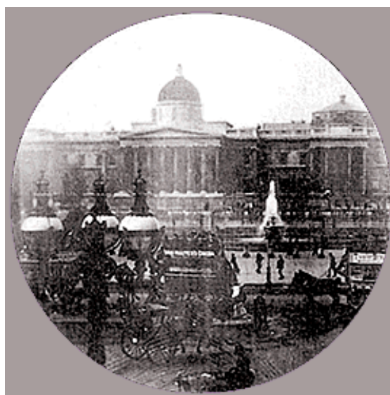
Trafalgar Square 1890 r.

Pierwszymi śladami działalności osadniczej na terenie Londynu są odkryte pozostałości po rzymskiej osadzie założonej najprawdopodobniej w 43 roku naszej ery, czyli w czasie inwazji wojsk cesarza rzymskiego Klaudiusza