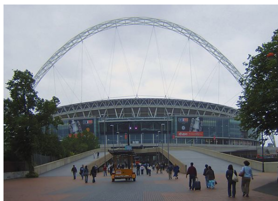
Stadion w dzielnicy Wembley oddany do użytku w 2007

Londyn posiada bogatą infrastrukturę sportową, w postaci stadionów, kortów tenisowych (Wimbledon), oraz licznych terenów rekreacyjnych (Green Park, Hyde Park itd.). Każdego roku na terenie miasta odbywają się dziesiątki rozmaitych imprez sportowych, trzy razy rozgrywane były tam Letnie Igrzyska Olimpijskie (w 1908, 1948 i 2012 roku).