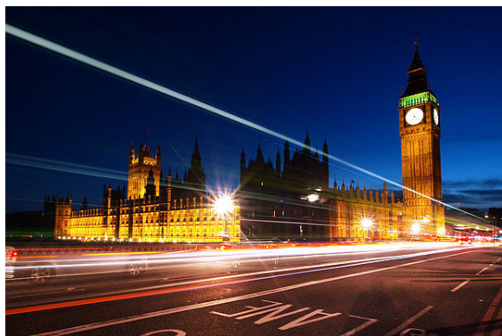
Big Ben i gmachy Parlamentu