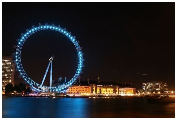
London Eye w nocy