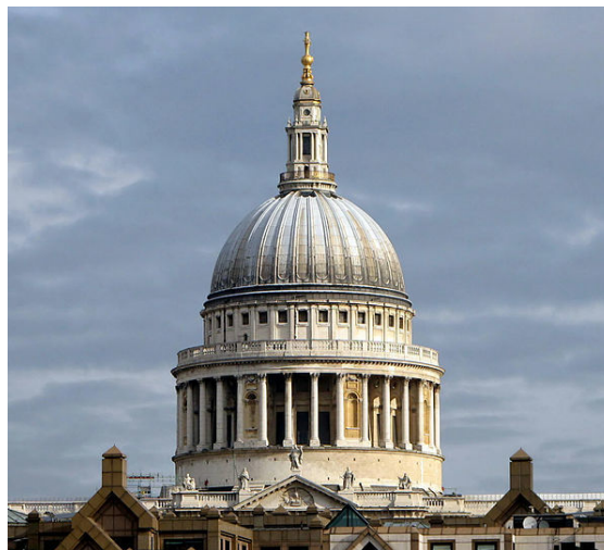
Katedra św. Pawła

Największą grupą religijną według spisu powszechnego z 2011 r. stanowili chrześcijanie – 48,4% mieszkańców Londynu. Kolejnymi religiami pod względem liczby wyznawców były: islam – 12,4%, hinduizm – 5,0%, judaizm – 1,8%, sikhizm – 1,5%, buddyzm – 1%. Inne religie wybrało 0,6% respondentów, zaś niewierzących było 20,7%. 8,5% respondentów nie podało swojej religii [14] . Jako ciekawostkę można podać że podczas ogólnokrajowego spisu statystycznego w 2001 roku ponad 1% mieszkańców miasta podało jako religię Jediizm, zjawisko to znane jest jako Fenomen rycerza Jedi.