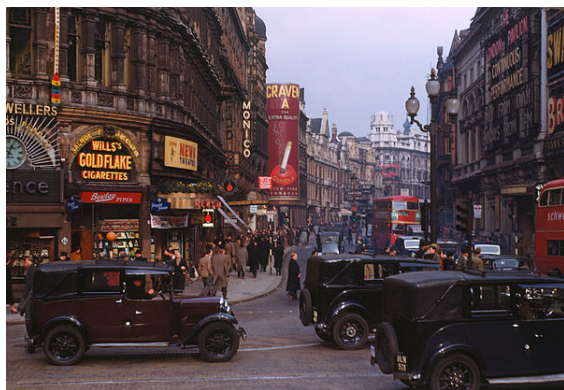
Piccadilly Circus 1949 r.