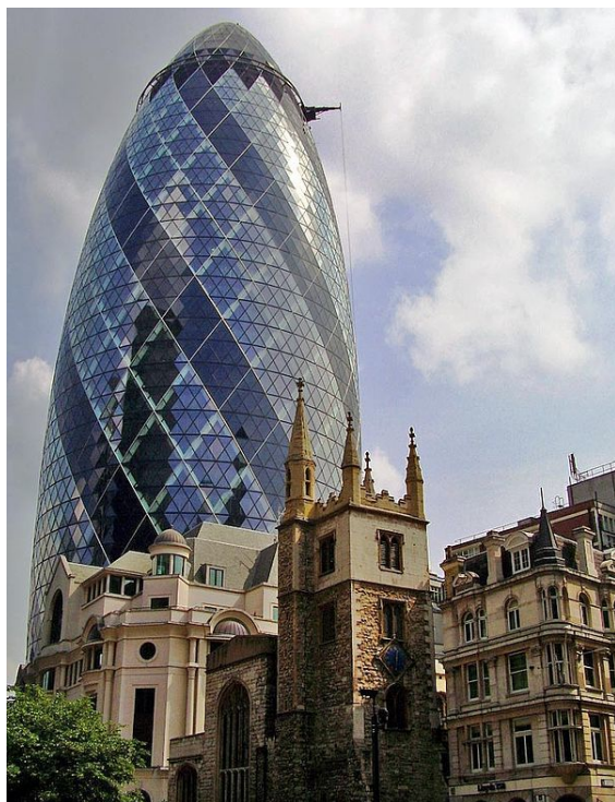
30 St Mary Axe

na Brytanię [6] . Odnaleziono także pozostałości po obozie warownym datowanym na lata 70-80 n.e. na wzgórzach Cornhill i Ludgate Hill . Rzymianie oznaczyli centrum Londinium kamieniem Londyńskim, który jest do tej pory widoczny na Cannon Street . Niemniej prawdopodobne jest, że osady miejscowej ludności istniały tu jeszcze przed przybyciem Rzymian na Wyspy Brytyjskie. Londyn głównie dzięki rozwojowi handlu z krajami kontynentu europejskiego (rzymska nazwa Londinium ) stał się jednym z najbogatszych miast Imperium. Za czasów rzymskich miasto liczyło ok. 30 tysięcy mieszkańców [7] .