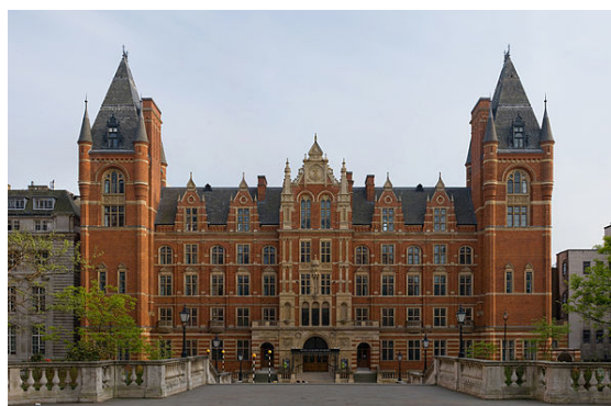
Royal College of Music

Londyn jest jednym z największych ośrodków akademickich w Wielkiej Brytanii. Znajduje się tam siedziba Towarzystwa Królewskiego, Uniwersytetu Londyńskiego, Polskiego Uniwersytetu na Obczyźnie oraz wielu innych uczelni. Państwowy Uniwersytet Londyński (ang. University of London ) mogący pochwalić się długimi tradycjami kształcenia, jest obecnie jednym z największych uniwersytetów w Europie, z liczbą 100 000 studentów.