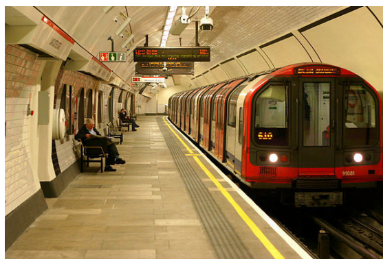
Metro w Londynie

Londyn jest wielkim węzłem komunikacji drogowej, krzyżuje się tam dziewięć autostrad oraz pięć innych ważnych dróg krajowych. Wszystkie połączone są z autostradą M25 , która tworzy pierścień wokół miasta.