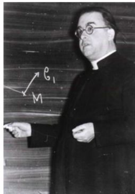
Monsignor Georges Lemaître ( 1894 - 1966 ) Belgian Roman Catholic prelate, astronomer and relativity cosmologist

'From a distance everyone will be able to read text, enlarged and limited to the desired subject, projected on an individual screen. In this way, everyone from his armchair will be able to contemplate the whole of creation, in whole or in certain parts.' - Paul Otlet