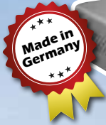
Abb.: Ortho Support® Basic