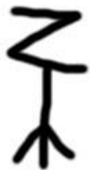
Symbol do uśmiercania przeciwników w zombiryźmie.