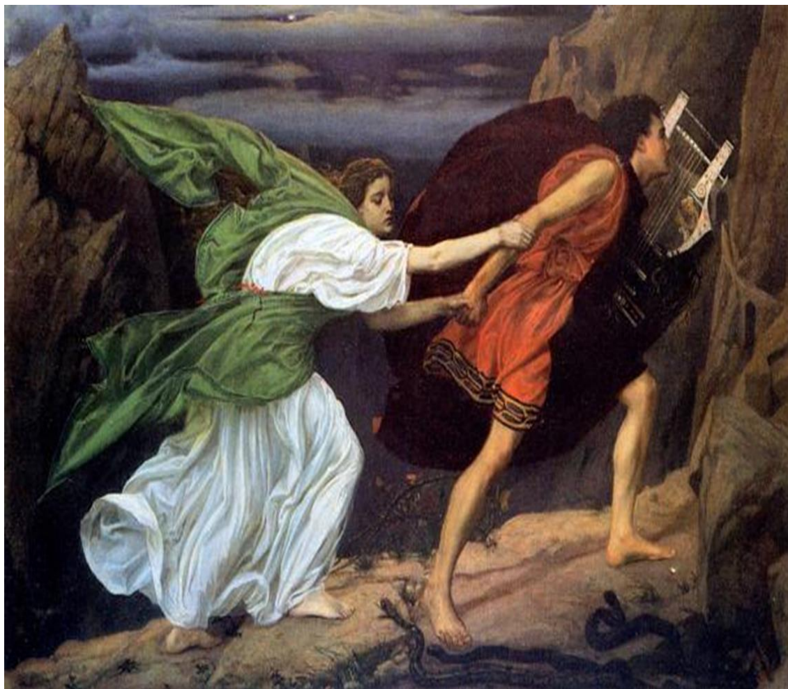
Ορφέας και Ευρυδίκη (Edward Poynter)

Και έτσι ο Ορφέας προχώρησε μπροστά και πήρε το δρόμο της επιστροφής. Και πίσω άκουσε τα απαλά βήματα της καλής του. Και μπροστά του έβλεπε το φως του ήλιου. Και ανυπομονούσε να δει τη καλή του.