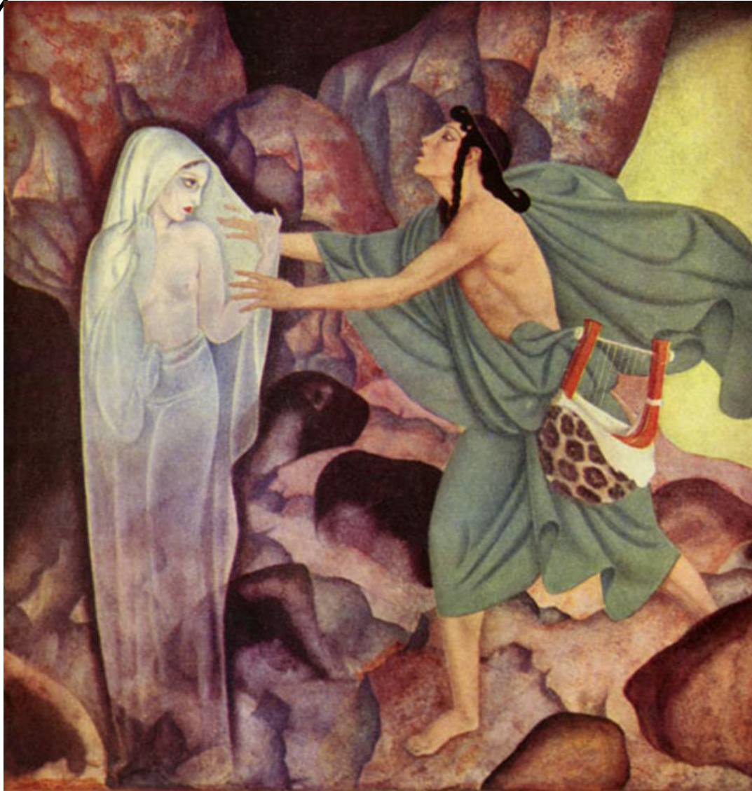
Ορφέας και Ευρυδίκη (Edmund Dulac)

Και όσο πλησίαζαν στην έξοδο, τόσο μεγάλωνε η ανυπομονησία του.