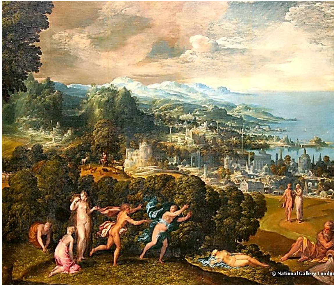
Ο θάνατος της Ευρυδίκης (Nicolo de l' Abate)

Και εκεί που έτρεχε πάτησε ένα φίδι και το φίδι τη δάγκωσε.