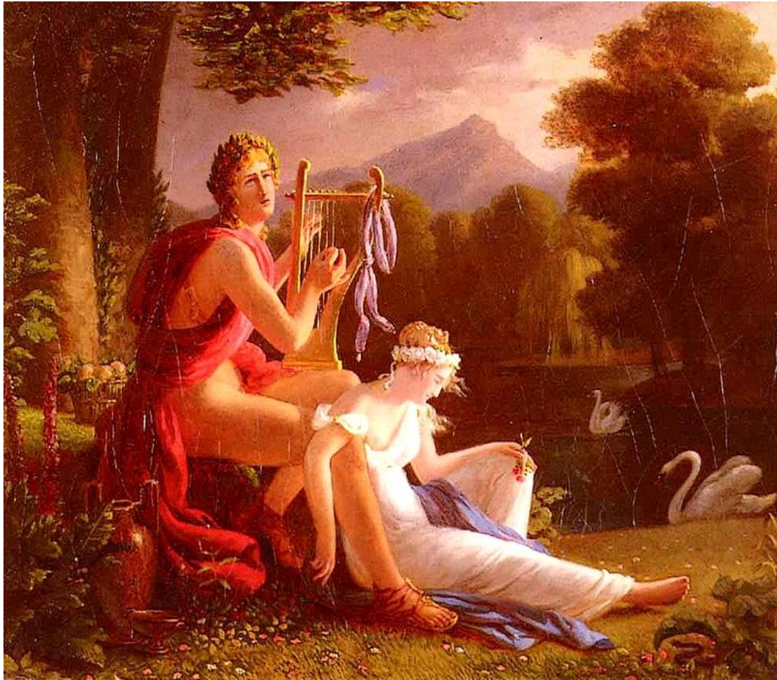
Ορφέας & Ευρυδίκη (Jean-Louis Ducis)

Και όταν απομακρύνθηκαν από το γλέντι, ο Αρισταίος προσπάθησε να πλησιάσει την Ευρυδίκη, τη γυναίκα του καλύτερου του φίλου.