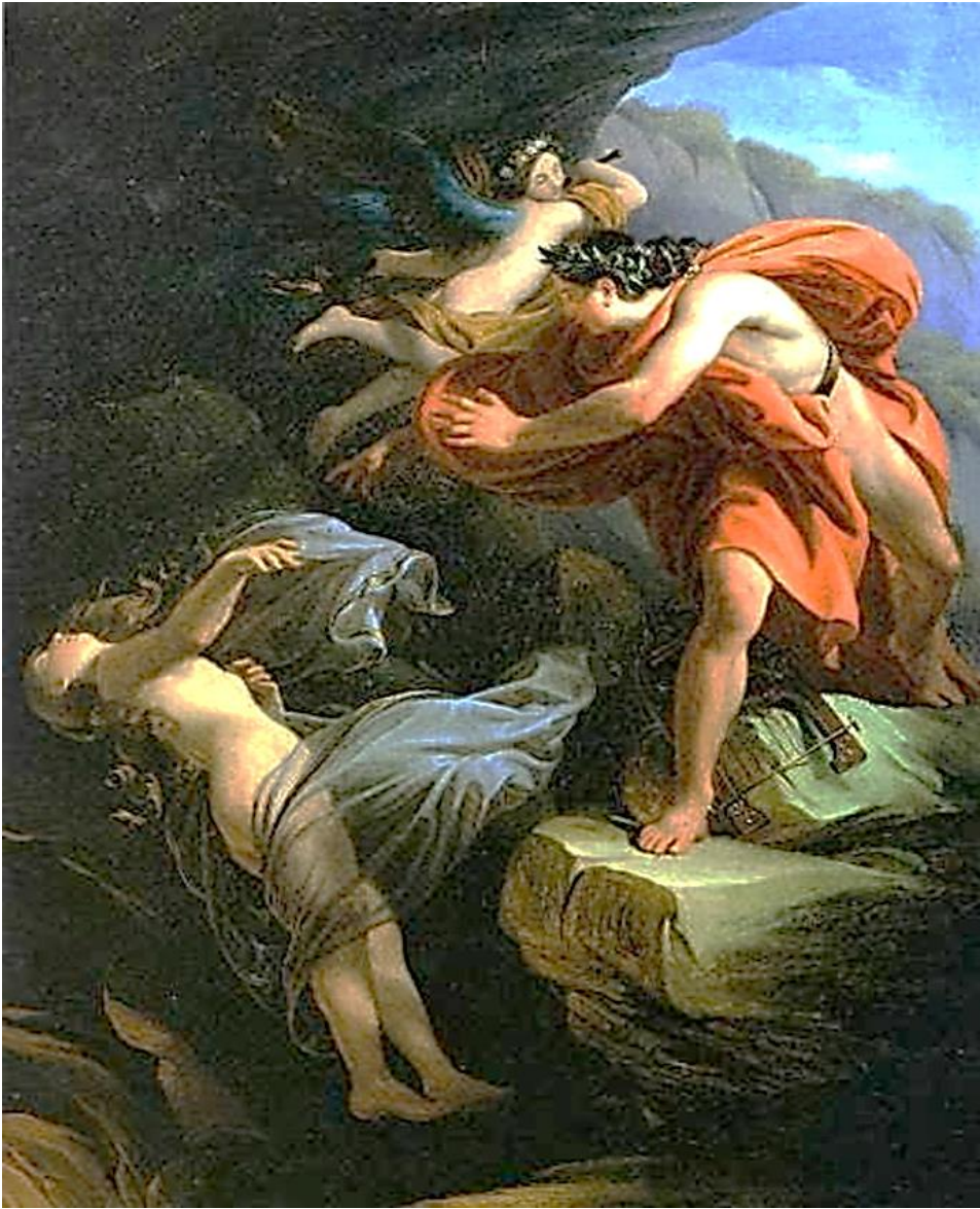
Ορφέας και Ευρυδίκη (Enrico Scuri)

...η Ευρυδίκη εξαφανίστηκε από μπροστά του.