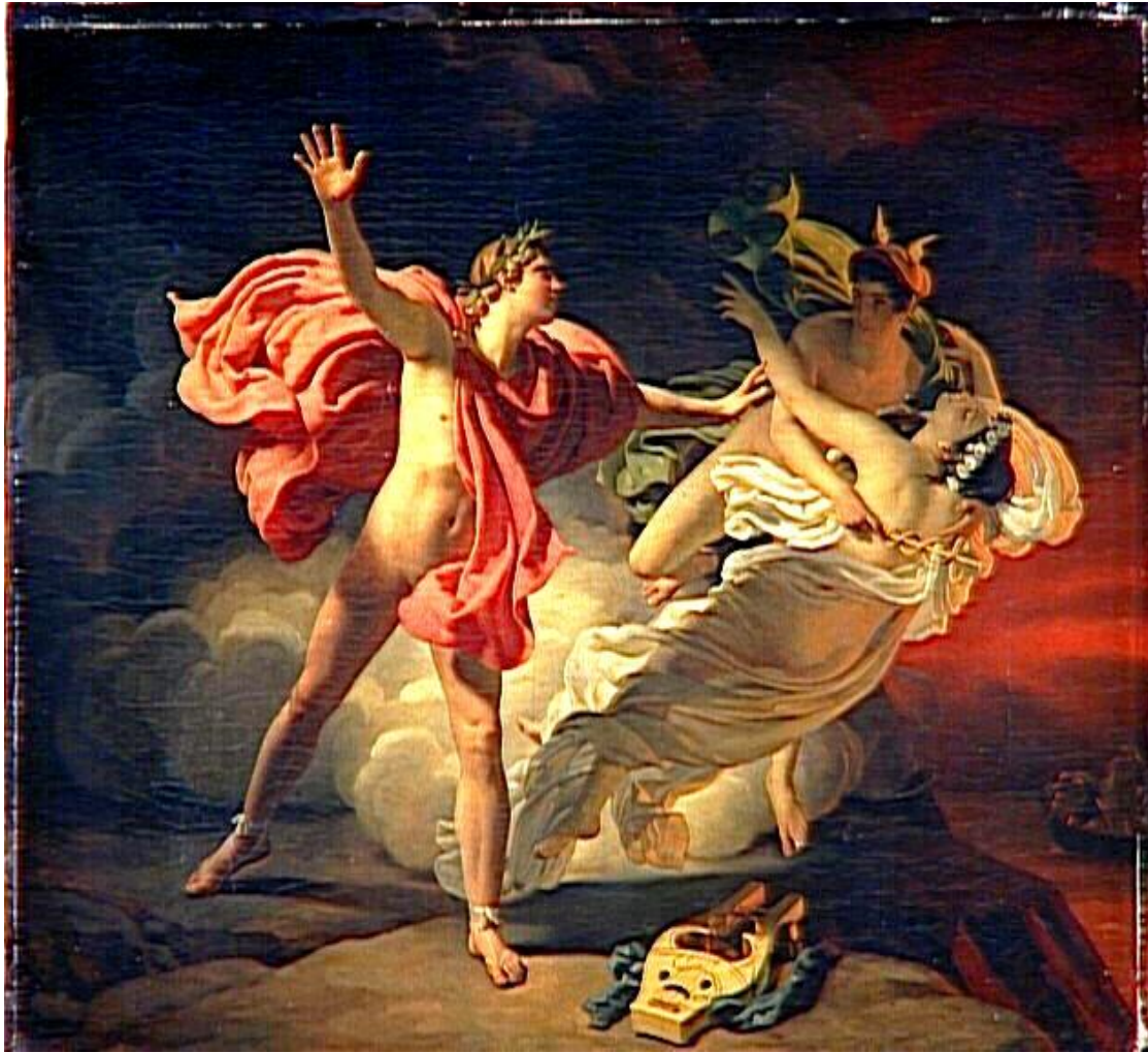
Ορφέας και Ευρυδίκη (Michel Martin Drolling)

Και τριγυρνούσε τις ερημιές και έπαιζε τη μουσική του για τα ζώα που πάντα τον πλησίαζαν για να τον ακούσουν.