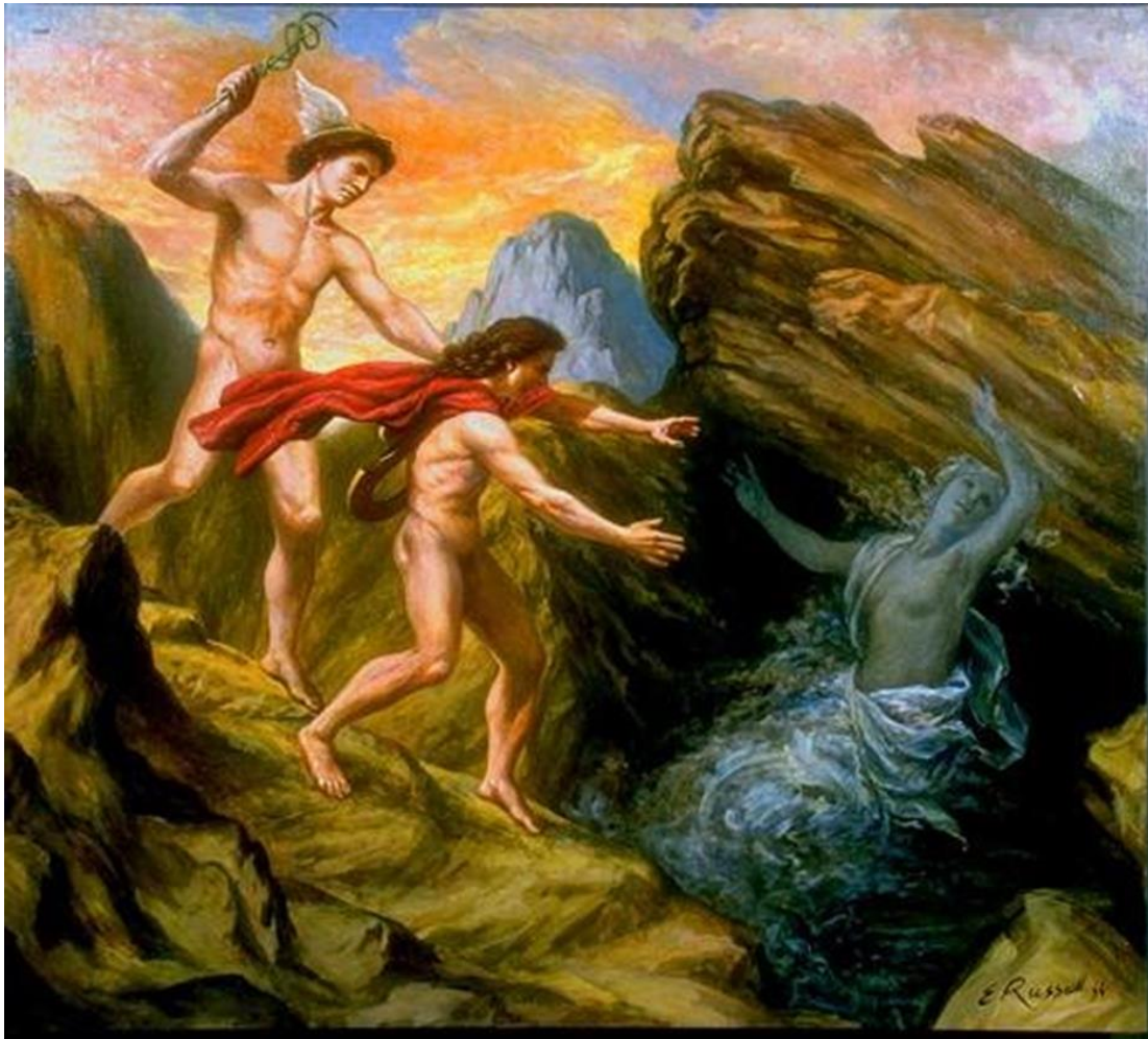
Ορφέας και Ευρυδίκη (Elsie Russell)

Από τότε λένε ότι ο Ορφέας έμεινε μόνος και ποτέ δεν αγάπησε πια άλλη γυναίκα.