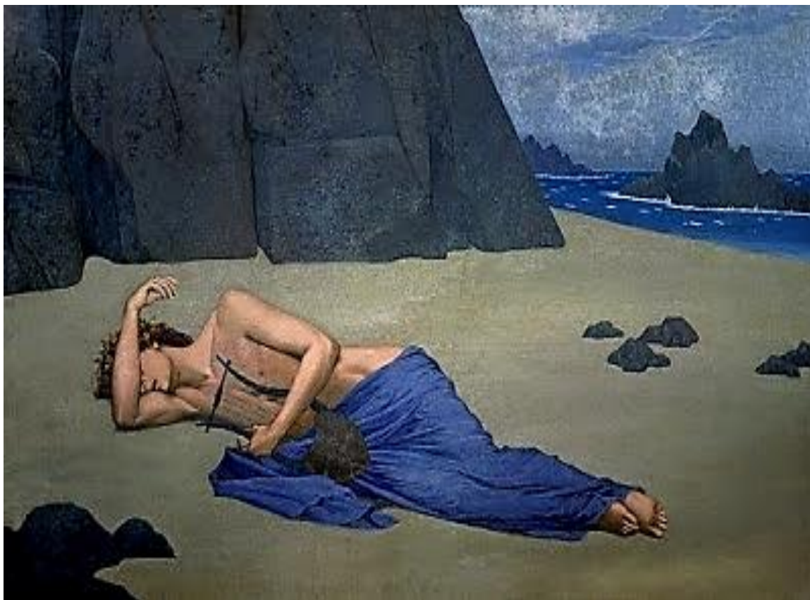
Ο θρήνος του Ορφέα (Alexandre Seon)

Δεν ήθελε να πιστέψει ότι η αγαπημένη του πέθανε. Δεν ήθελε να φανταστεί τη ζωή του μακριά της. Και έτσι ξεκίνησε να τη βρει. Ξεκίνησε να πάει στο μέρος που κανείς ζωντανός δε πατάει. Ξεκίνησε να πάει στον Κάτω Κόσμο , στο βασίλειο του Πλούτωνα και της Περσεφόνης . Πάει στην άκρη των ακρών, στον ποταμό Αχέροντα. Και ο Ορφέας πλήρωσε το βαρκάρι και εκείνος τον πέρασε απέναντι.