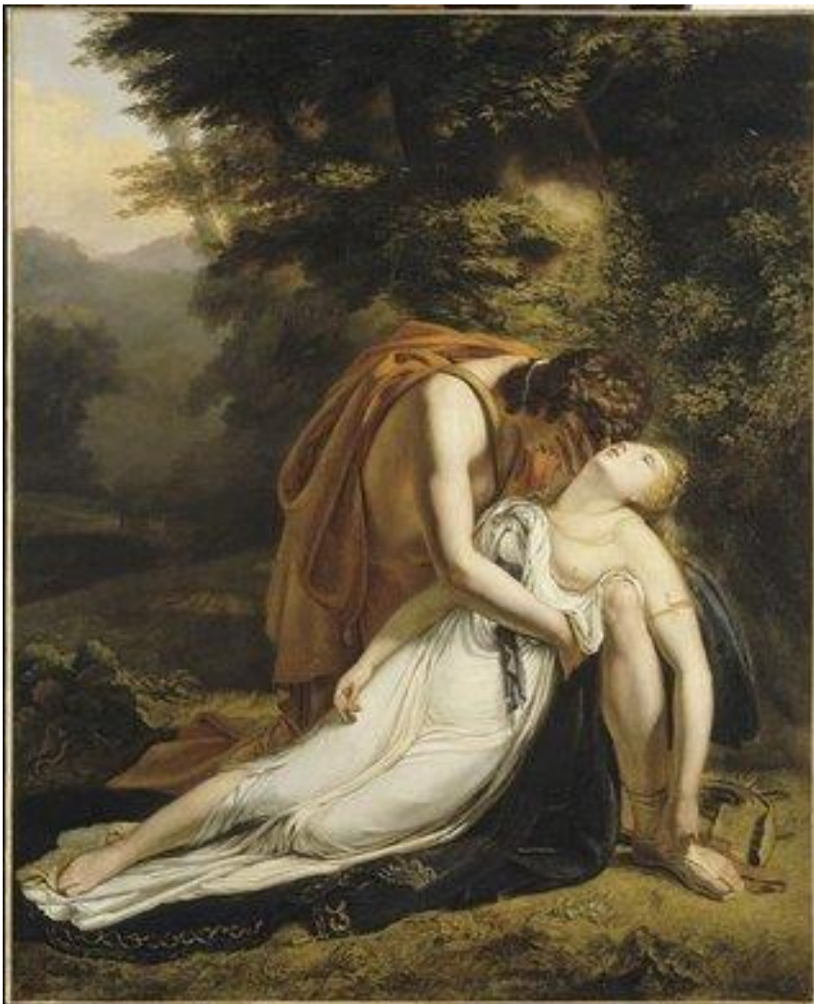
Ο θάνατος της Ευρυδίκης (Ary Scheffer)

Η απόγνωση και ο πόνος του Ορφέα δεν περιγράφονταν.