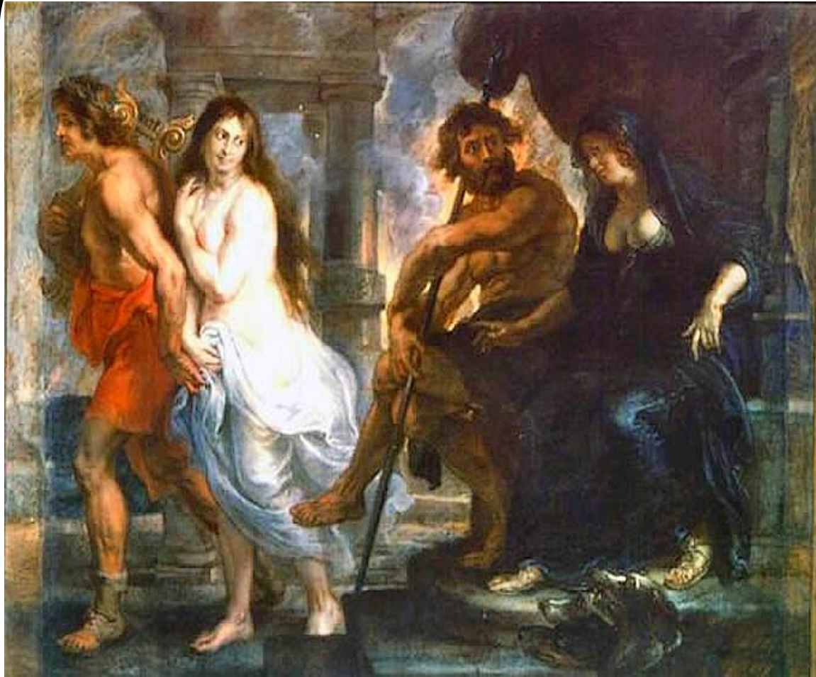
Ο Πλούτωνα ελευθερώνει την Ευρυδίκη (Peter Paul Rubens)

Και οι θεοί του Κάτω Κόσμου του υποσχέθηκαν να του δώσουν την Ευρυδίκη. Αλλά τον προειδοποίησαν να μην γυρίσει πίσω να την κοιτάξει μέχρι να περάσουν την είσοδο του Κάτω Κόσμου και να βγουν στο φως.