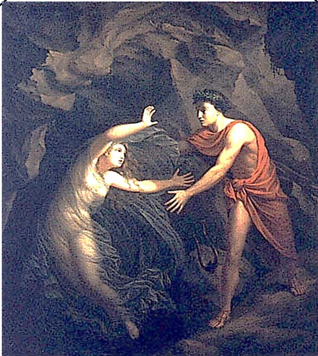
Ορφέας και Ευρυδίκη (C. Kratzenstein-Stub)