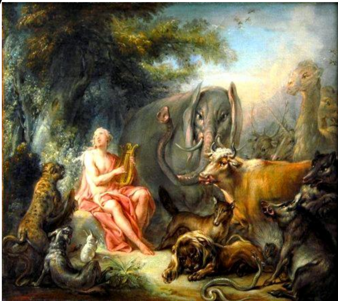
Ο Ορφέας «μαγεύει» τα ζώα με τη μουσική του (Boucher)

Κάποτε στην Θράκη ζούσε ένας βασιλιάς, ο Οίαγρος . Και αυτόν τον βασιλιά ερωτεύτηκε η Καλλιόπη , η μούσα της επικής ποίησης. Και έκαναν έναν γιο, τον Ορφέα . Ο Ορφέας μεγάλωσε και έγινε μεγάλος ήρωας. Μα το μόνο του όπλο ήταν η λύρα του και η μουσική του. Λένε ότι όταν τραγουδούσε τα ζώα μαζευόταν γύρω του και τα ποτάμια σταματούσαν να κυλούν και τα σύννεφα να περνούν.