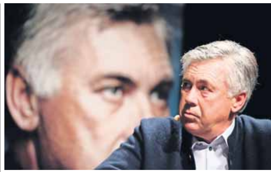
Leckerschmecker hin oder her: Bis jetzt immerhin hatte dieser Mann Erfolg im Beruf wie in der Liebe. Carlo Ancelotti am Montag in der Münchner Muffathalle.

Dass Ancelotti als Spieler und Trainer, zum Beispiel beim AC Mailand, dem FC