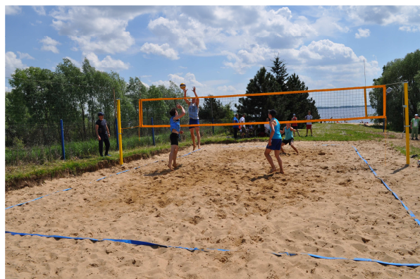
Boisko do siatkówki