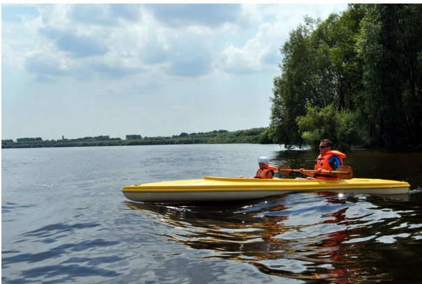
Kajakiem po Jeziorisku