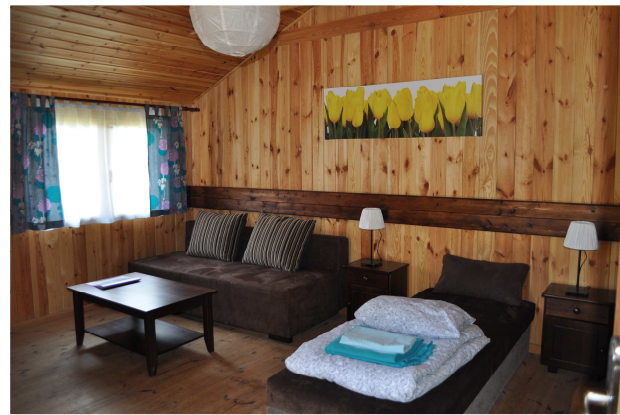
Domek Standard Plus