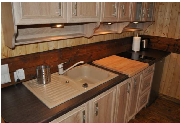
Domek Standard Plus