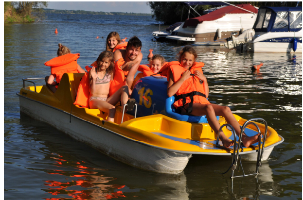
Rower wodny - 5 osobowy