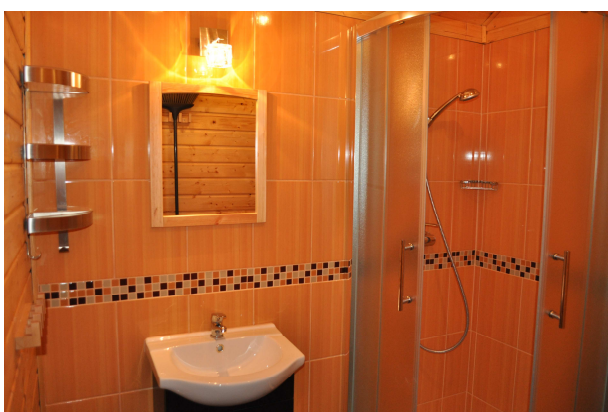
Domek Lux - łazienka