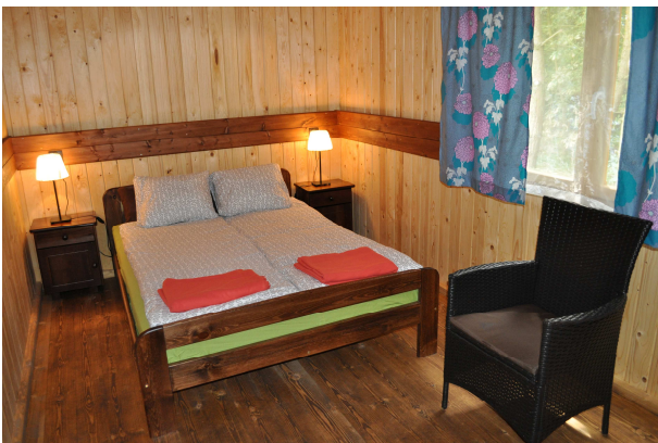
Domek Family Large