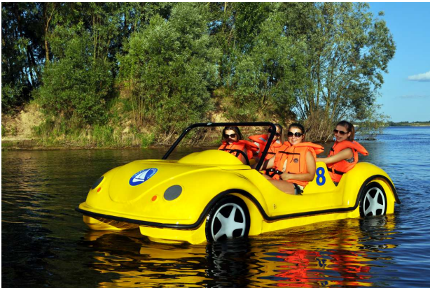
Rower wodny Volkswagen Cabrio