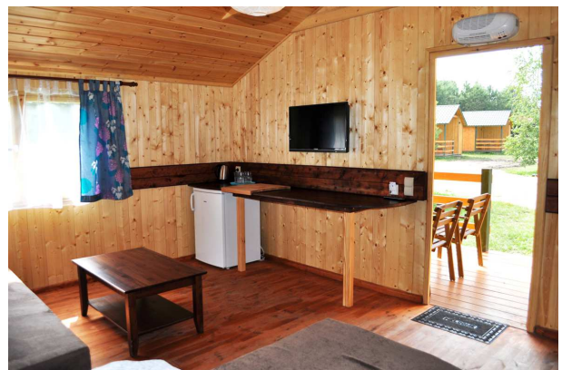
Domek Family Large