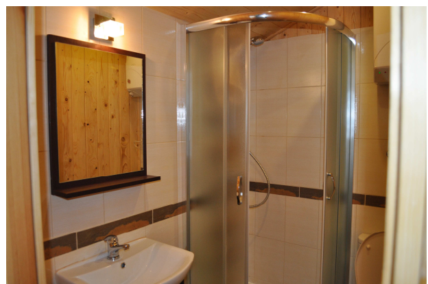
Domek Standard Plus – łazienka