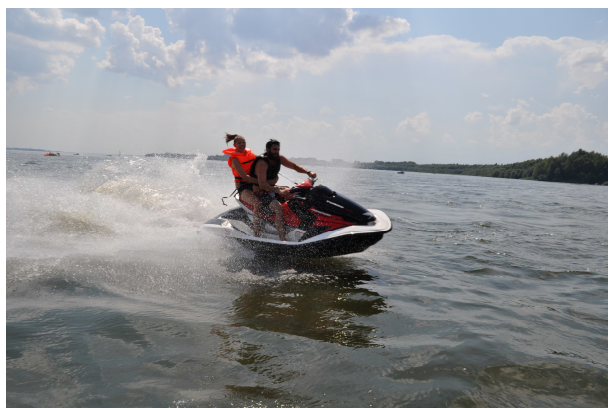
Przejażdżka skuterem wodnym