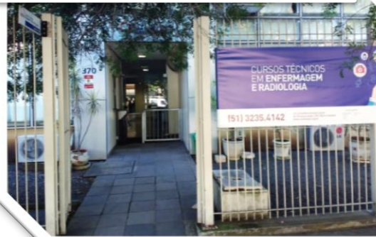
Prédio - Escola Profissional