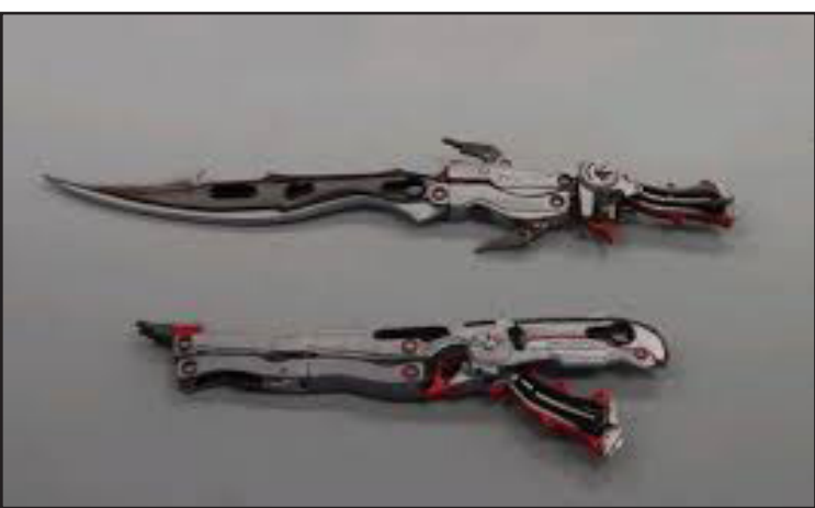
Final Fantasy XII / Final Fantasy XIII-2 Lightning Farron - riproduzioni spade in legno

Sono state costruite con legno sovrapponendolo in sottili strati per garantirne la leggerezza.