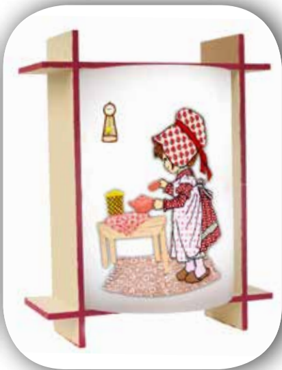
דגם הולי הובי