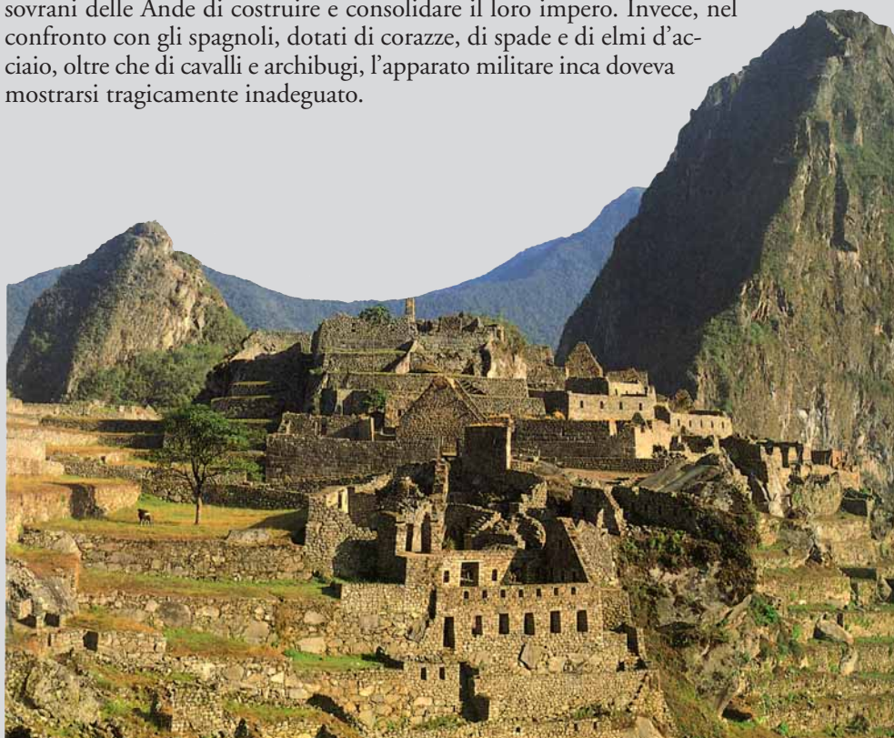
Machu Picchu, sito archeologico dell'ultimo periodo inca, a 2450 metri di altezza sulle Ande, in Perù.