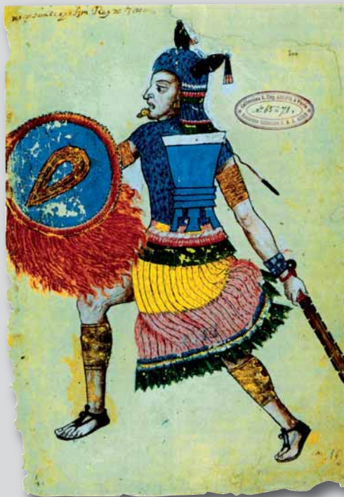
Un guerriero azteco in battaglia, illustrazione tratta da un codice del XVI secolo.

Inoltre, nonostante le vittorie e le conquiste, lo spettro della carestia non abbandonò mai Tenochtitlán, in costante crescita demografica ; in effetti, i tributi provenienti dal-