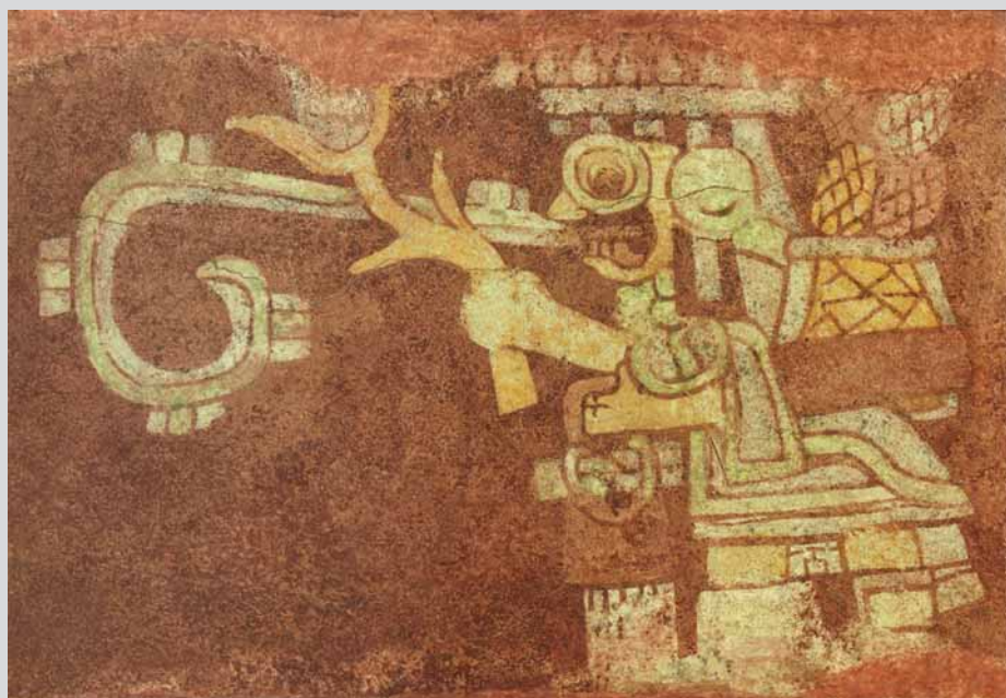
Pittura murale maya del VII secolo a.C. raffigurante il dio della pioggia Tlaloc, mentre raccoglie il mais (Città del Messico, Museo Nazionale di Antropologia).

Più tardi, si svilupparono le civiltà dei maya e dei toltechi . La prima raggiunse il suo massimo sviluppo, nel Messico meridionale e in Guatemala, tra il 250 e il 900 d.C. Al tempo della conquista spagnola, tuttavia, esistevano ancora varie città-Stato maya, che opposero resistenza agli invasori europei. I toltechi («persone civili») si imposero tra il X e l'XI secolo d.C., nel Messico del Nord. Essendo