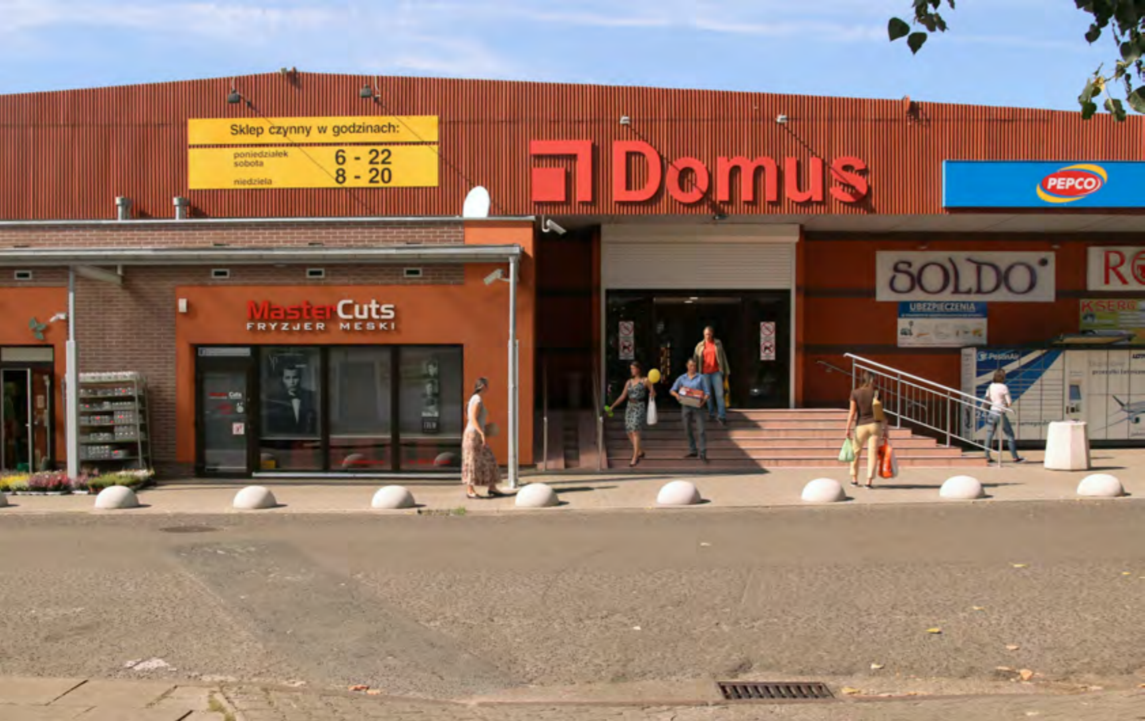
„Pasożytnictwo” fotografia druk fotografia wyświetlana na telefonie 2016

Fotografia miejsca publicznego wobec ochrony i wykorzystania cudzego wizerunku.