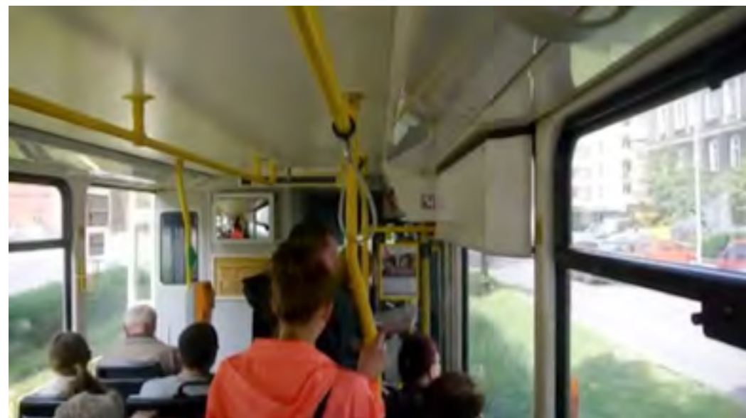
„linia 8” video 2014

https://www.youtube.com/watch?v=x-vMbajl_nA