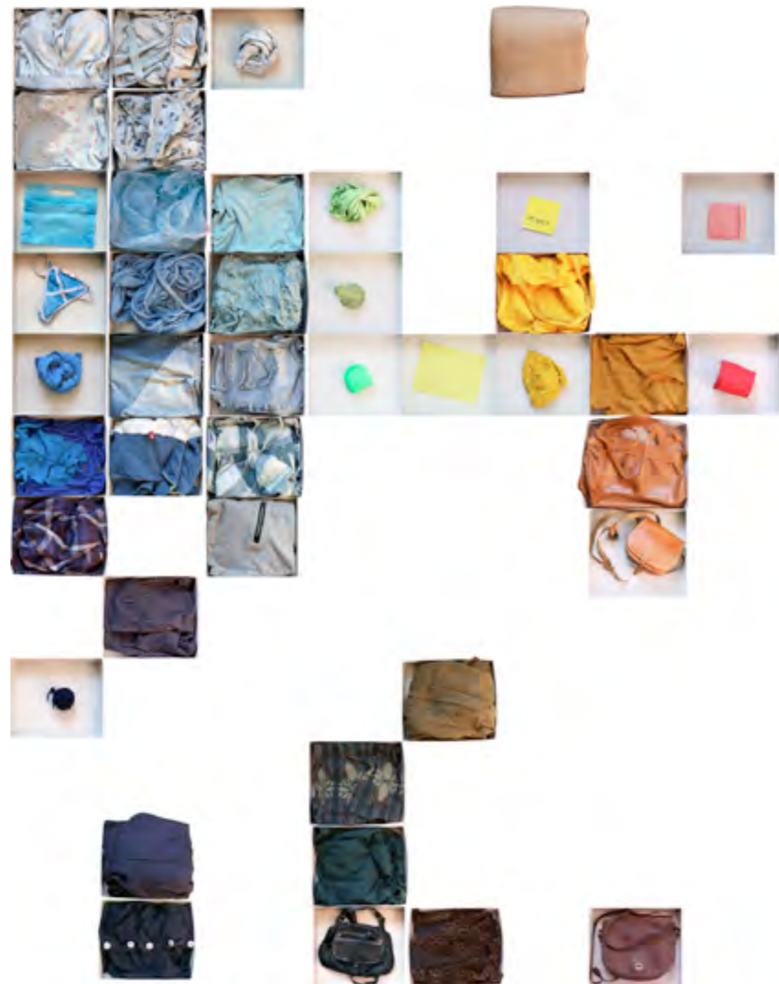
„Ciuchy które wyrzuciłam wiosną 2016” fotografia 2016

Rzadko uchwytany moment, próba złapania przedmiotu pomiędzy „użyteczny” – „bezużyteczny” – „użyteczny”.