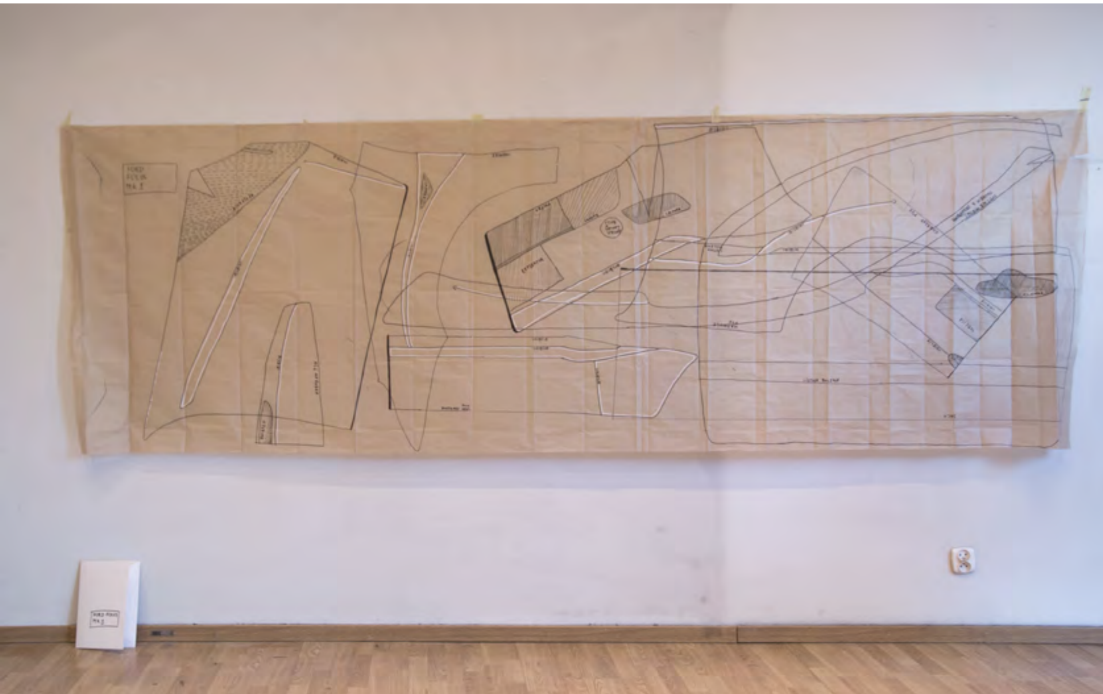
„Ford Focus M1” rysunek na papierze 2017

Moja inspiracja do odrysowywania „wykrojów” karoserii samochodów mieści się pomiędzy kobiecą czułością ręcznych robótek i surową technologiczną precyzją.