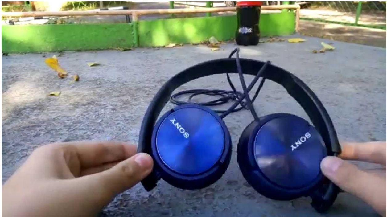
Afbeelding 1: Sony MDR-ZX30 koptelefoon