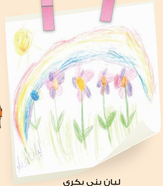
ليان بني بكري