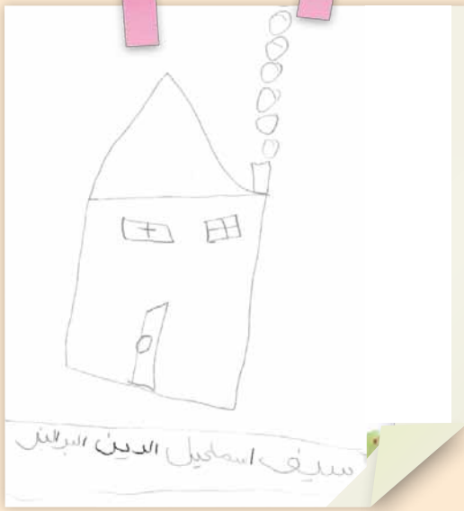
سيف اسماعيل البوالي