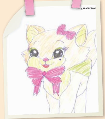
ديسانا علاء فخري