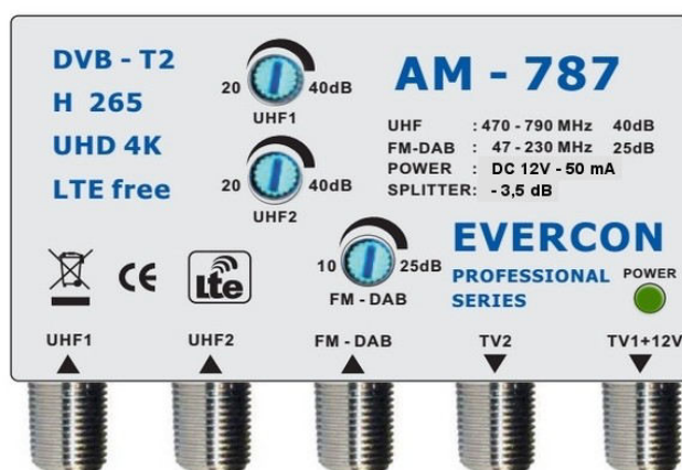
anténa1 anténa2 VKV radio připojení k nap.zdroji DAB radio a výstupy signálu

Napájecí zdroj je samostatným prvkem rozvodu a není součástí balení anténního zesilovače , je tedy nutno jej zakoupit samostatně - doporučujeme zdroj PSU-212 nebo PS-101