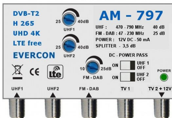
anténa1 anténa2 VKV radio připojení k nap.zdroji DAB radio a výstup signálu

Zisk jednotlivých antén lze regulovat - a největší zesílení nemusí být tou nejlepší volbou - pokud tedy některé kanály kostkují zkuste zesílení dané antény snížit a znovu naskenovat problematický kanál . Signály z jednotlivých antén se také mohou ovlivňovat - každá anténa přijímá kromě hlavního signálu také signál odražený a fázově posunutý . Postup zapojení - nejdříve připojte antény a poté napájecí zdroj a úplně nakonec zapojte zdroj do zásuvky 230V - měly by svítit kontrolky jak na zdroji tak i na zesilovači pokud tomu tak není - je v obvodu zkrat a je potřeba jej odstranit.