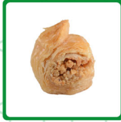
كول وشكور كاجو