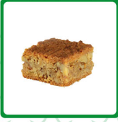
معمول مد جوز