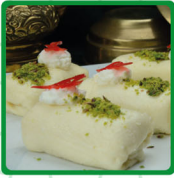
حلاوة الجبن لف