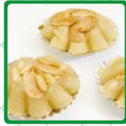
تاج الملك لوز