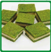
هريسة الفستق باللوز