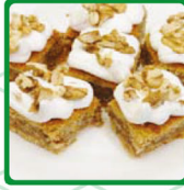
كرايبج مد جوز