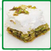
كرايبج مد مستق