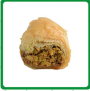
كول وشكور فستق