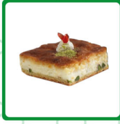
معمول مد بالقشطة