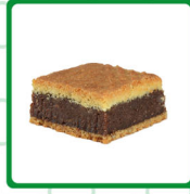
معمول مد تمر