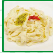
حلاوة الجبن عادي