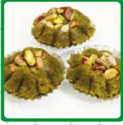
تاج الملك فستق