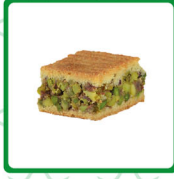
معمول مد فستق