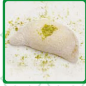
حلاوة الرز بالقشطة