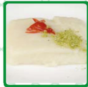
حلاوة الرز بالجينة