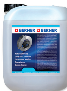
5 l / 30 l