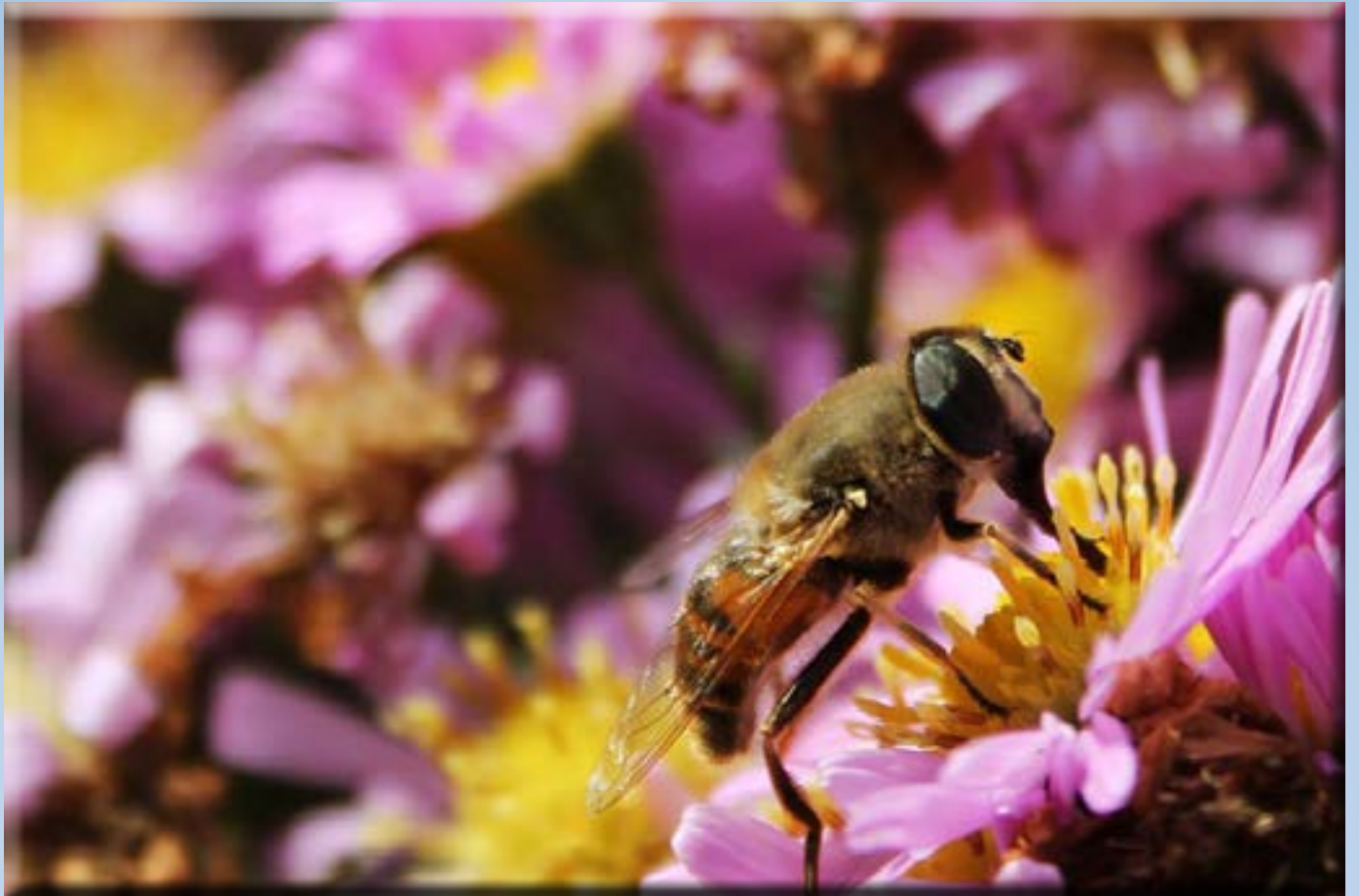
Победничка слика са светосавског фото конкурса