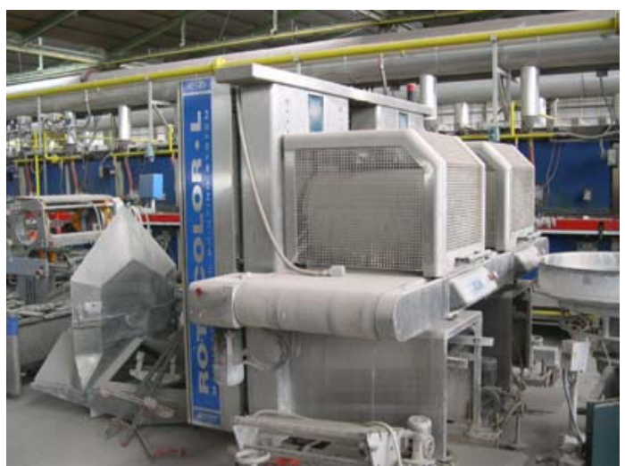
SERIGRAFIA - ROTOCOLOR