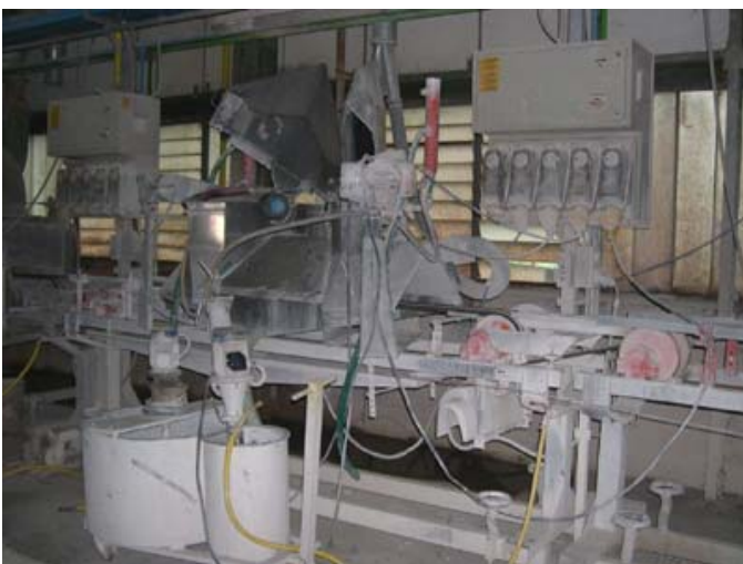
CABINA A DISCO