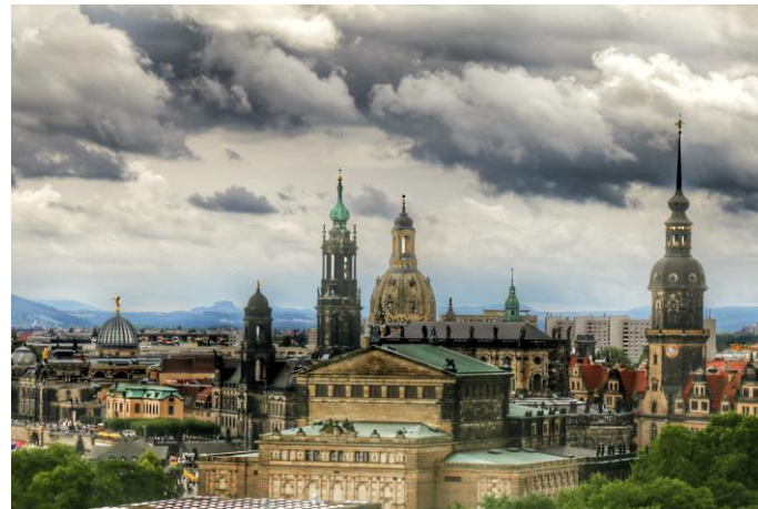
verschiedene Historische Baustile in ästhetische Einheit

Herzstück unserer Tätigkeit ist die Öffentlichkeitsarbeit. Vor allem über soziale Netzwerke wirken wir diskussionsfördernd und versuchen bestmöglich aufzuklären. Ziel ist es, ein Interesse für das zu wecken, was Dresden als Kulturmetropole vor der Zerstörung war, aber auch zu sensibilisieren mit zeitgemäßen Mitteln aktuelle Chancen für eine bestmögliche und zukunftsfähige Stadtreparatur und Stadtentwicklung zu nutzen.