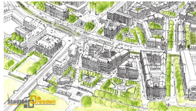
Vision einer Bebauung des Königsufers, Zeichnung: P. Jeyabalan

Ausarbeitung stadtteilgerechter, rechtsverbindlicher Gestaltungssatzungen oder bindender Richtlinien in städtebaulich bedeutenden Bereiche nach den gestalterischen Grundsätzen der Regionaltypik (Dresden typische Architektur).