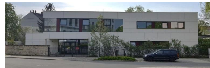
Kita Konkordienstraße, Ecke Moritzbirger Straße in Pieschen

Vor allem ortsfremde Investoren überziehen - unter Duldung verschiedener Stadtratsmehrheiten - die Innenstadt so stringent mit Globalisierungs-Architektur, dass mittlerweile von einer 3. Zerstörung gesprochen werden kann. Die Bauvorhaben der Stadt Dresden selbst – Bäder, Schulen, Kitas – untermauern diesen gestalterischen Nihilismus.