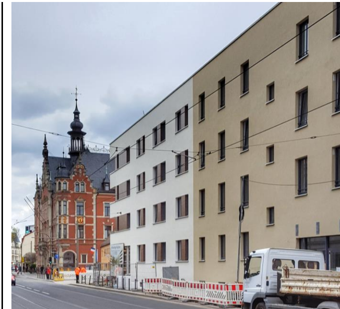
Bürgerstraße - Rathaus Pieschen 1891 (li) Wohnhäuser 2017 (re)

Solange der Modernismus als DIE Lösung angepriesen und wortgewandt mit Phrasen aus dem Werbehandbuch für Architekten (z.B.: „... besticht durch seine angenehme Richtungslosigkeit...“, „...wirkt in seiner Umgebung spannend...“, „...Transparenz großstädtischer Intimität...“) verkauft wird, und der genüsslich zelebrierte Bruch, Provokation und die gewollte Belanglosigkeit des Funktionalen als Elemente von Architektur in Dresden beibehalten werden, so wird dies zu Recht von vielen Dresdnern ablehnend aufgenommen und der Blick für Alternativen geschärft.