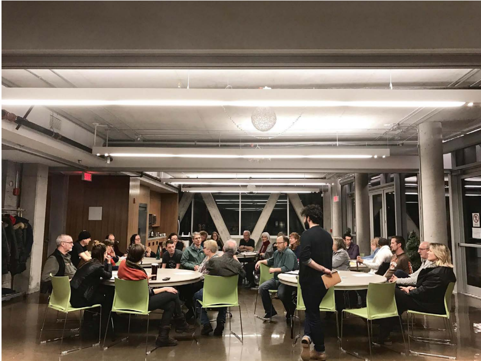
MOBILISATION LORS D'UNE RENCONTRE