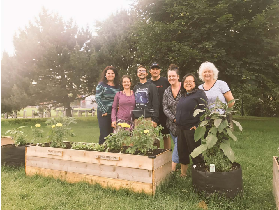
COMITÉ DE CITOYENS