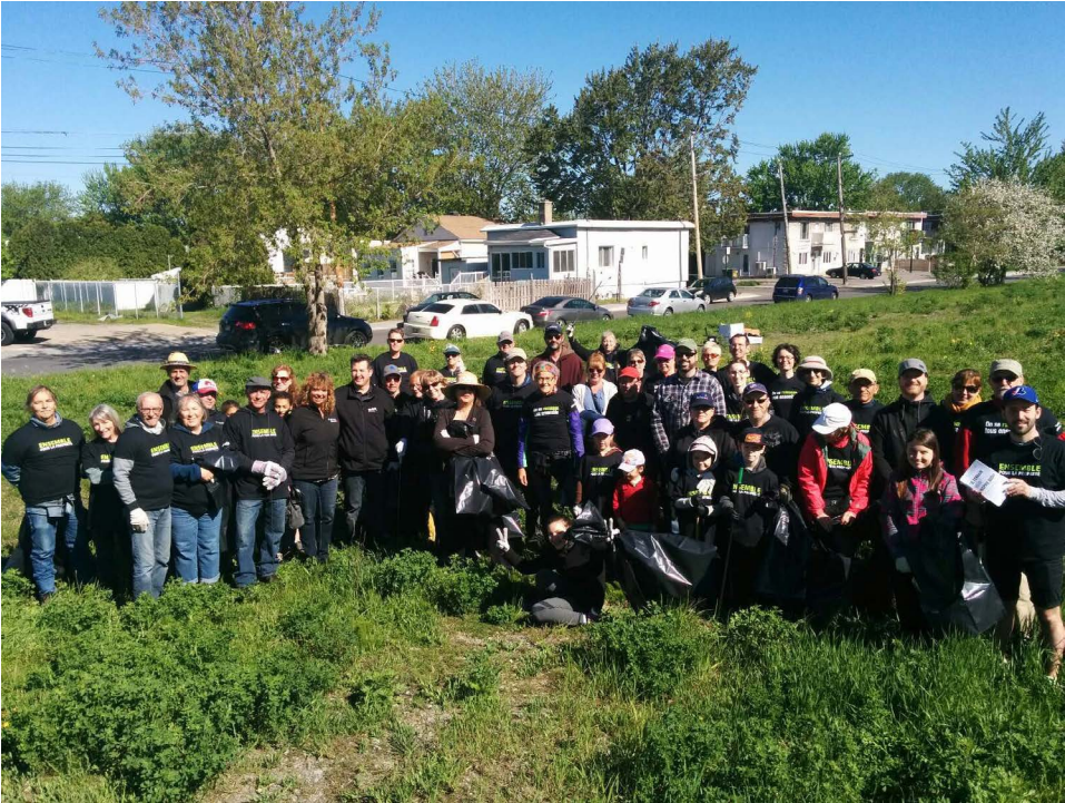
CORVÉE DE LA FRICHE