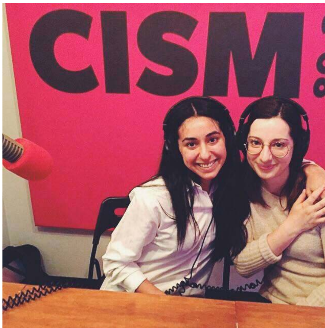
VACANT À VIBRANT, PROJET FÉMININ DE LA SEMAINE À CISM, MAI 2017