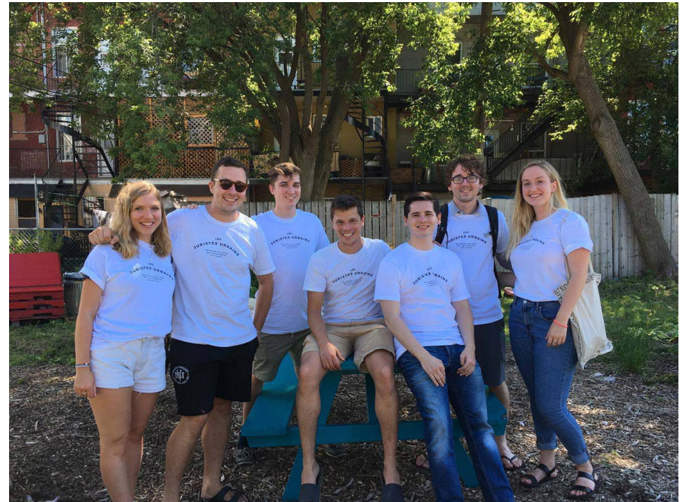
AVOCATS BÉNÉVOLES PARTICIPANTS AU PROJET