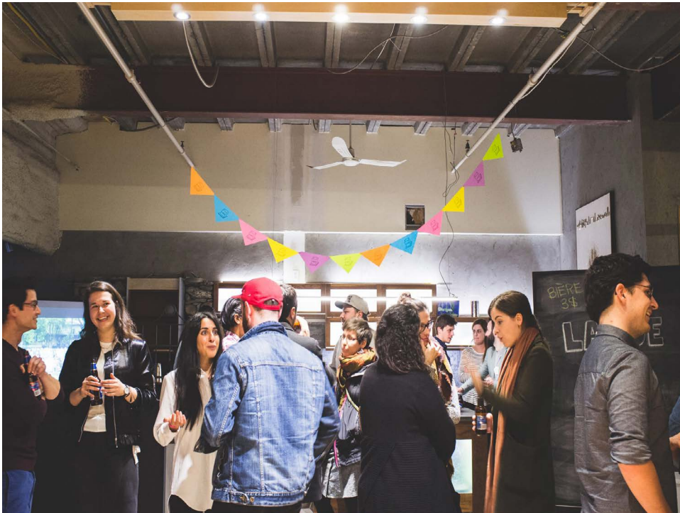
5@7 SOCIOFINANCEMENT, MAI 2017