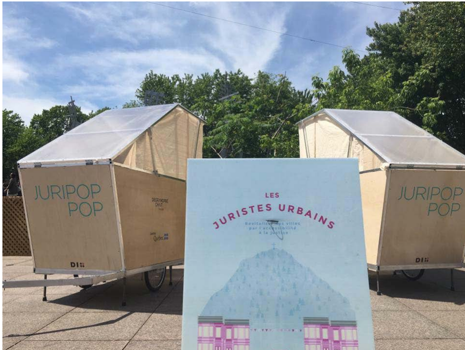
JURIPOP POP, CRÉÉS SPÉCIALEMENT POUR LES CONSULTATIONS SUR TERRAINS VACANTS