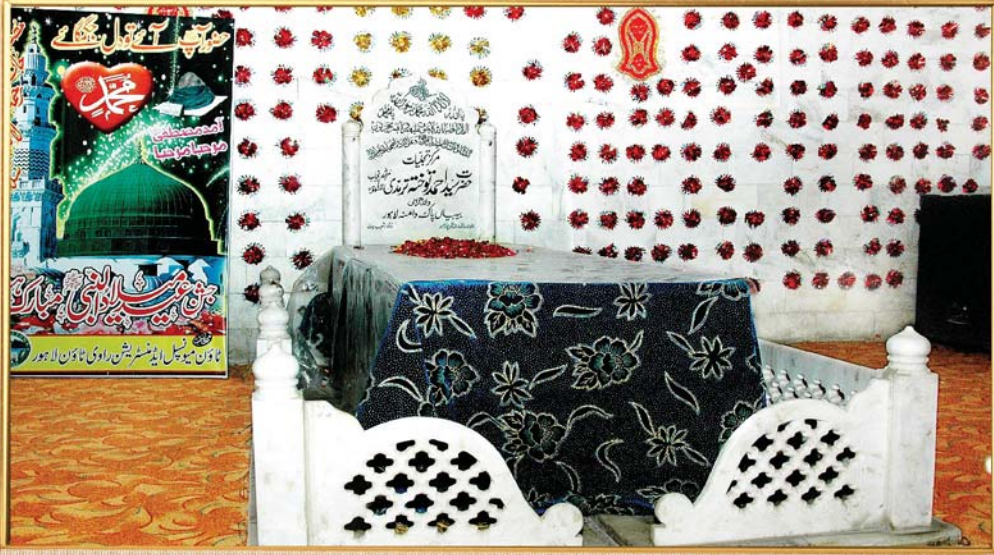
لاہور: شاہ احمد المعروف توختہ، مثال رسول اور مرشد پنجاب کے مزار کا اندرونی منظر۔