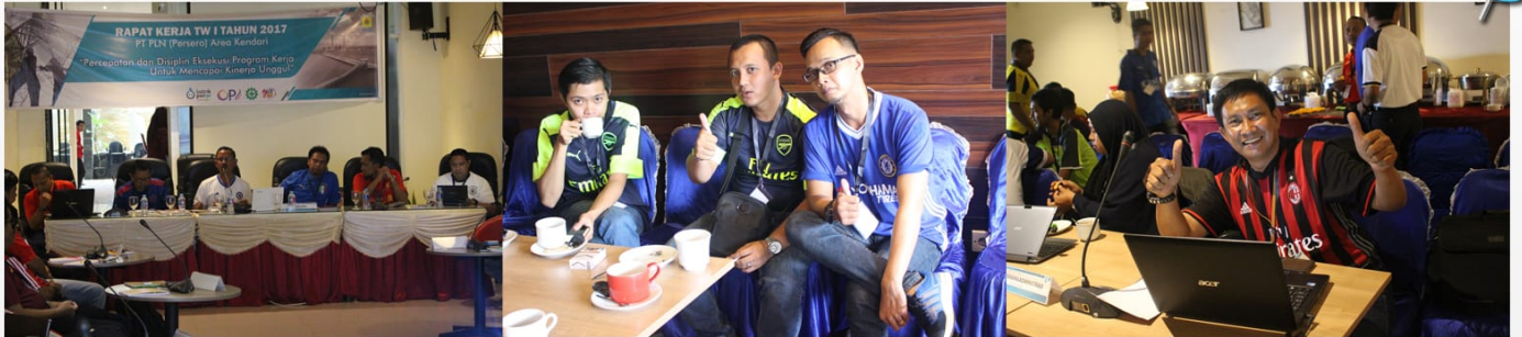
Photo : Rapat Kerja Triwulan I Tahun 2017 dilanjutkan dengan Acara Malam Ramah Tamah Pisah Sambut Manajer PT PLN (Persero) Area Kendari.