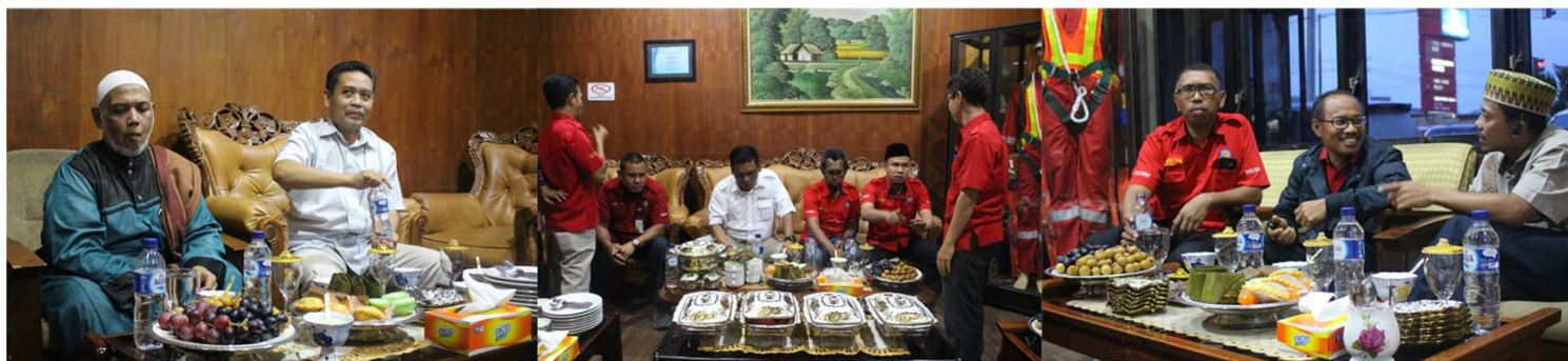
Photo : Acara Buka Bersama Pegawai PT PLN (Persero) Area Kendari dengan Tim P2TL Wilayah yang diselenggarakan di lobi PT PLN (persero) Area Kendari, Rabu 07 Juni 2017.