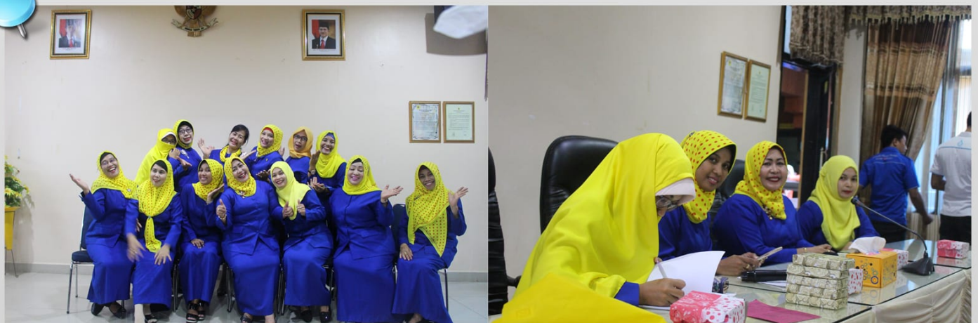
Photo : Arisan Persatuan Ibu - Ibu PLN AKD